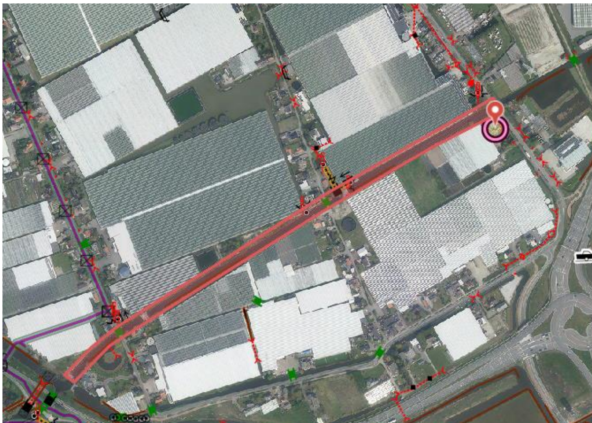
Afbeelding 1: locatie stremming

Omdat de werkzaamheden te laat zijn ingediend, de werkzaamheden in het vaarseizoen plaatsvinden en er geen alternatieve vaarroute is, is besloten de melding met een verkeersbesluit af te doen. Op deze wijze kunnen er specifieke voorschriften en verkeersmaatregelen aan de stremming en de inrichting hiervan worden voorgeschreven. Er wordt een gedeeltelijke stremming toegestaan, waarbij altijd het vaarverkeer de werkzaamheden vlot en veilig moet kunnen passeren.