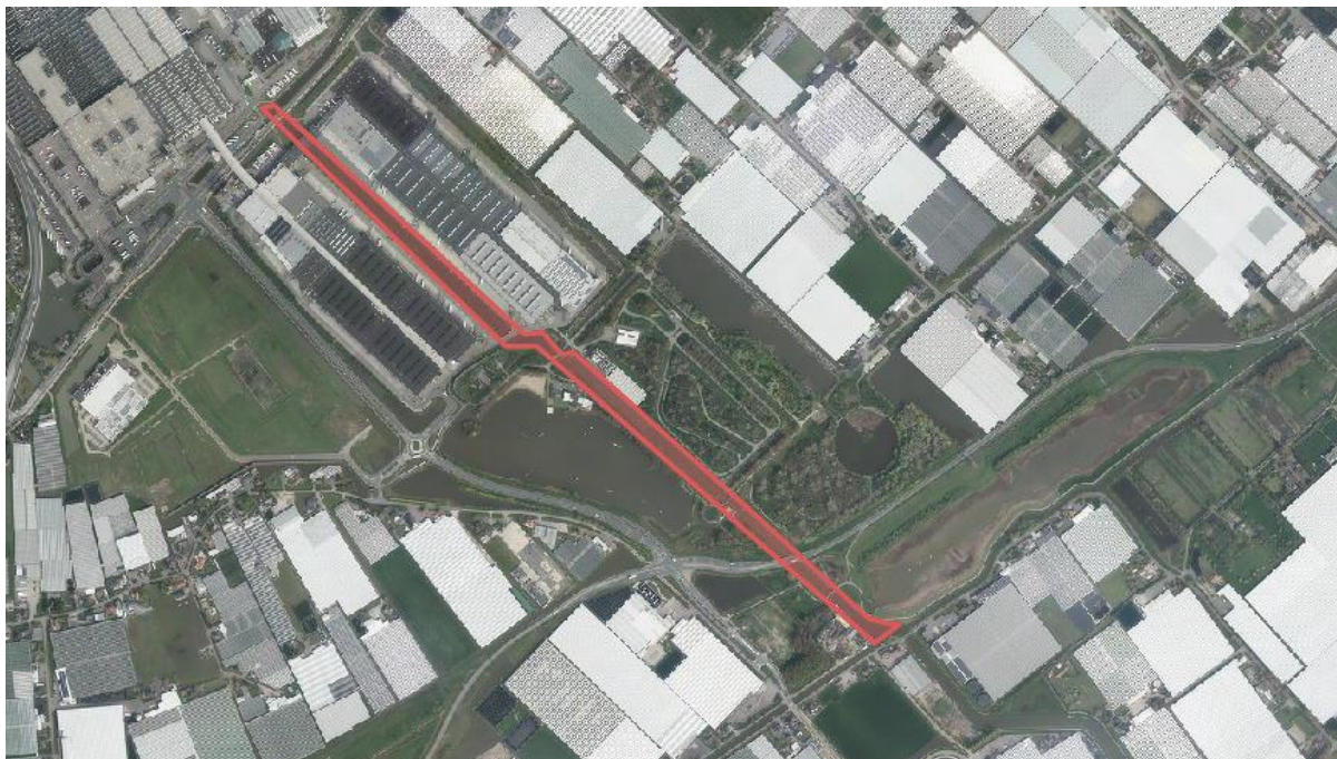
Afbeelding 1 stremming in rood aangegeven

Op 12 mei 2024 tussen 8:00 tot en met 11:00 uur zal de volledige vaarweg, zoals op onderstaande afbeelding is weergegeven, worden gestremd en moeten er verkeersmaatregelen worden getroffen om de veiligheid van het vaarverkeer te garanderen.