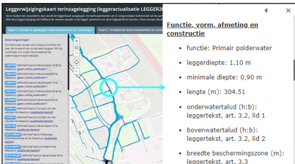
Figuur 1: Voorbeeldweergave van de interactieve leggerwijzigingskaart