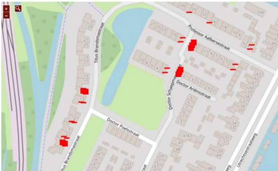
Figuur 4: Locaties voor het plaatsen van tien tijdelijke nestkasten (rode vierkanten, HMT1 Unitura) voor huismus ten behoeve van mitigatie. Omdat voldoende onderzoek naar vleermuizen voor een aantal adressen nog ontbreekt, zijn ook alvast zestien kleine vleermuisvoorzieningen opgehangen (rode strepen, VMT1 Unitura). Zie hiervoor ook hoofdstuk 5.4.

In afwijking op Figuur 4 geldt deze ontheffing alleen voor de twee gevonden huismusnesten binnen het plangebied zoals besproken in paragraaf "C) Ecologische beoordeling".