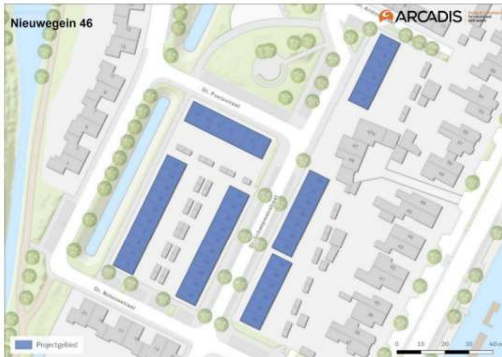
Figuur 1. Ligging projectgebied in de bebouwde kom van Nieuwegein.

In afwijking op Figuur 1 vormen de woning aan de Dr. Schaeppmansstraat 19 t/m 43 geen onderdeel van het plangebied.