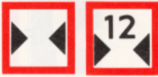
Bord C.3, breedte overgebleven vaarweg