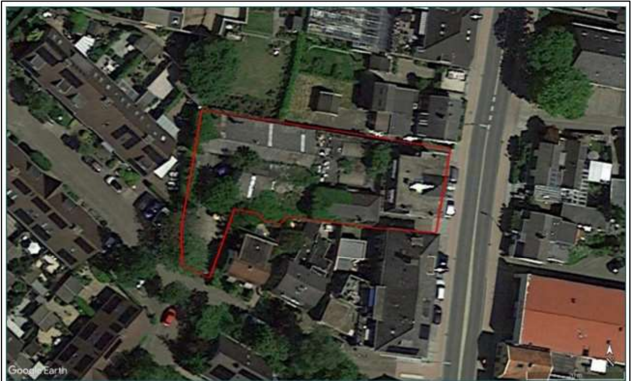
Figuur 1.1 Overzicht van de planlocatie aan de Amersfoortseweg 49a te Doorn (Overgenomen uit: Kijm, 2021).

Figuur 1: Locatie van het plangebied (bron: mitigatieplan Amersfoortseweg 49a te Doorn van 15 januari 2024).