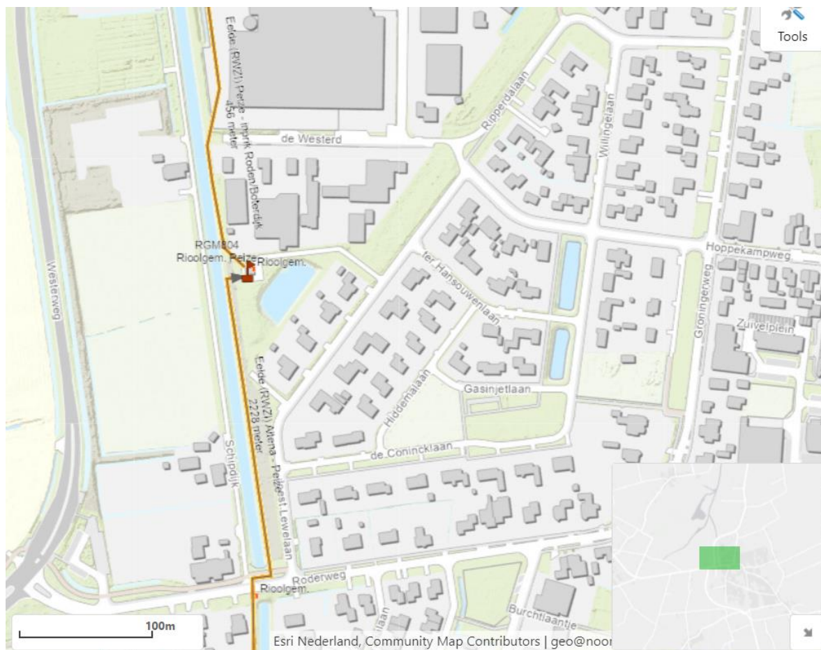
Figuur 1 - Globale ligging persleiding (oranje lijn)