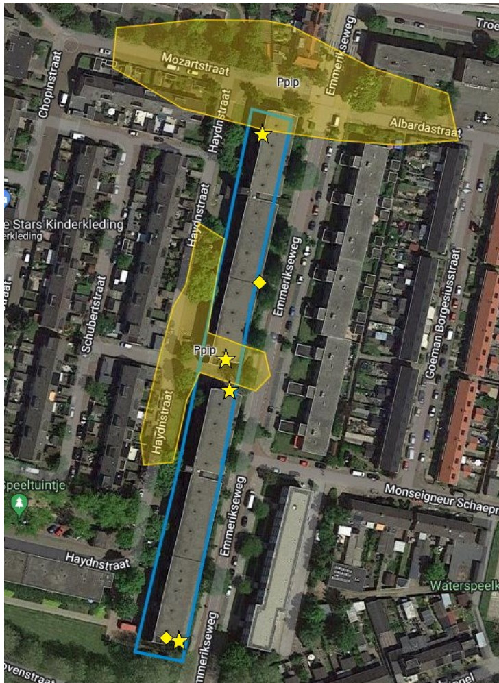
Figuur 2. Visualisatie van de in 2021 aangetroffen verblijfplaatsen en territoria van de gewone dwergvleermuis. Het projectgebied is hier blauw omlijnd. Een geel gearceerd gebied geeft een baltslocatie weer. Een gele ster staat voor de locatie van een zomerverblijf en een gele ruit geeft de locatie van een kraamverblijfplaats aan.