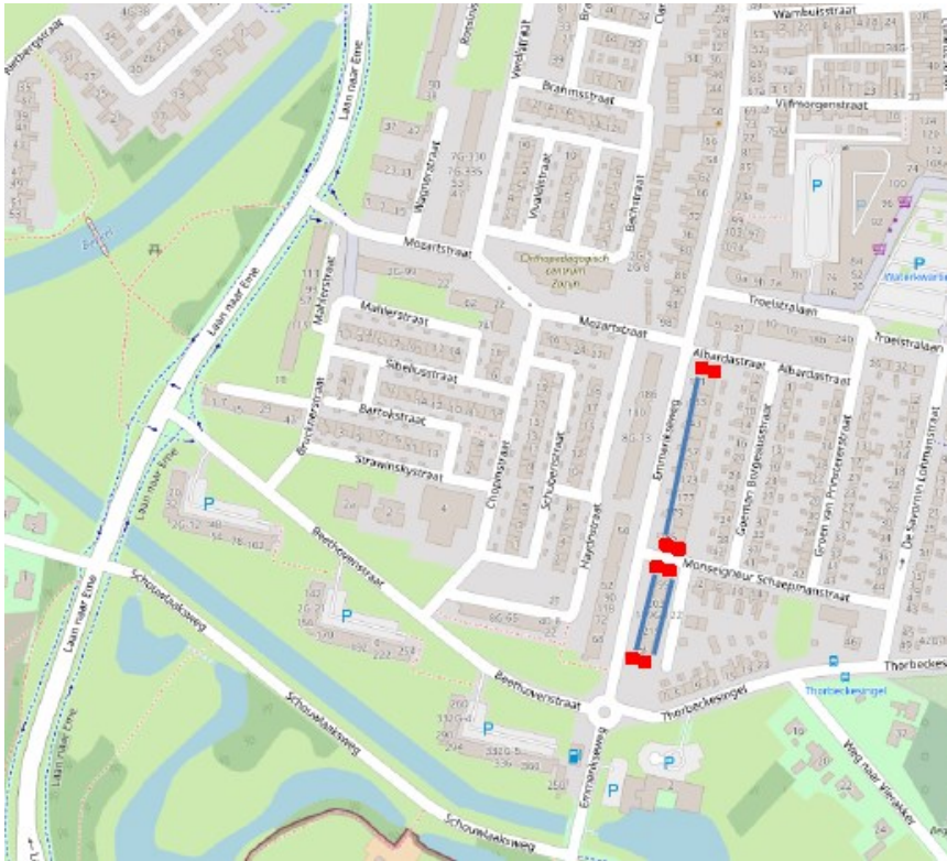
Figuur 3. De locaties van de tijdelijke voorzieningen voor de gewone dwergvleermuis. De locaties van de 8 tijdelijke vleermuiskasten (type VK SK 02, Vivara Pro) zijn in rood weergegeven. De 24 tijdelijke vleermuiskasten (type VK MP 05, Vivara Pro) zijn verspreid over de in blauw aangegeven gevels.