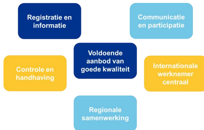
Figuur 3: speerpunten van het regionaal beleidskader

Met dit regionaal beleidskader wordt de basis gelegd voor een intensivering van de bestaande samenwerking tussen de 18 regiogemeenten én marktpartijen. Een goede regionale samenwerking tussen de regiogemeenten, maar ook met marktpartijen (werkgevers en huisvesters) die samen de beleidsopgaven willen realiseren en waarin elke partij zijn eigen verantwoordelijkheid pakt. De opgave is integraal en complex en vraagt daarom om een goede governance waarbij de zaken die we afspreken slagvaardig kunnen worden uitgevoerd maar niet vrijblijvend zijn. Dit vraagt ook om een gedegen monitoring.