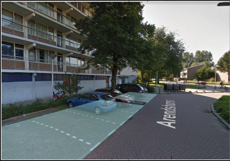
Opslag terrein op parkeerplekken