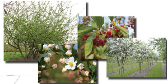
Malus toringo 'Sargent's Elegant' meerstammig