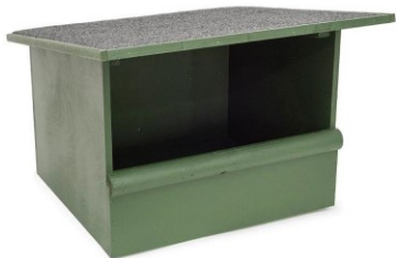
Figuur 2 Torenvalkkast type RK TO 01 van Vivara Pro.

Voordat het nest wordt verwijderd, worden twee torenvalkkasten type RK TO 01 van Vivara pro (of kwalitatief gelijkwaardig, zie figuur 2) geplaatst ten noorden van de kolenvelden. De kasten worden gemonteerd op een 4 m hoge paal en de opening wordt naar het noorden of oosten geplaatst. De nestkasten worden niet direct onder hoogspanningslijnen geplaatst. In de nestkasten wordt een dunne laag houtsnippers aangebracht.