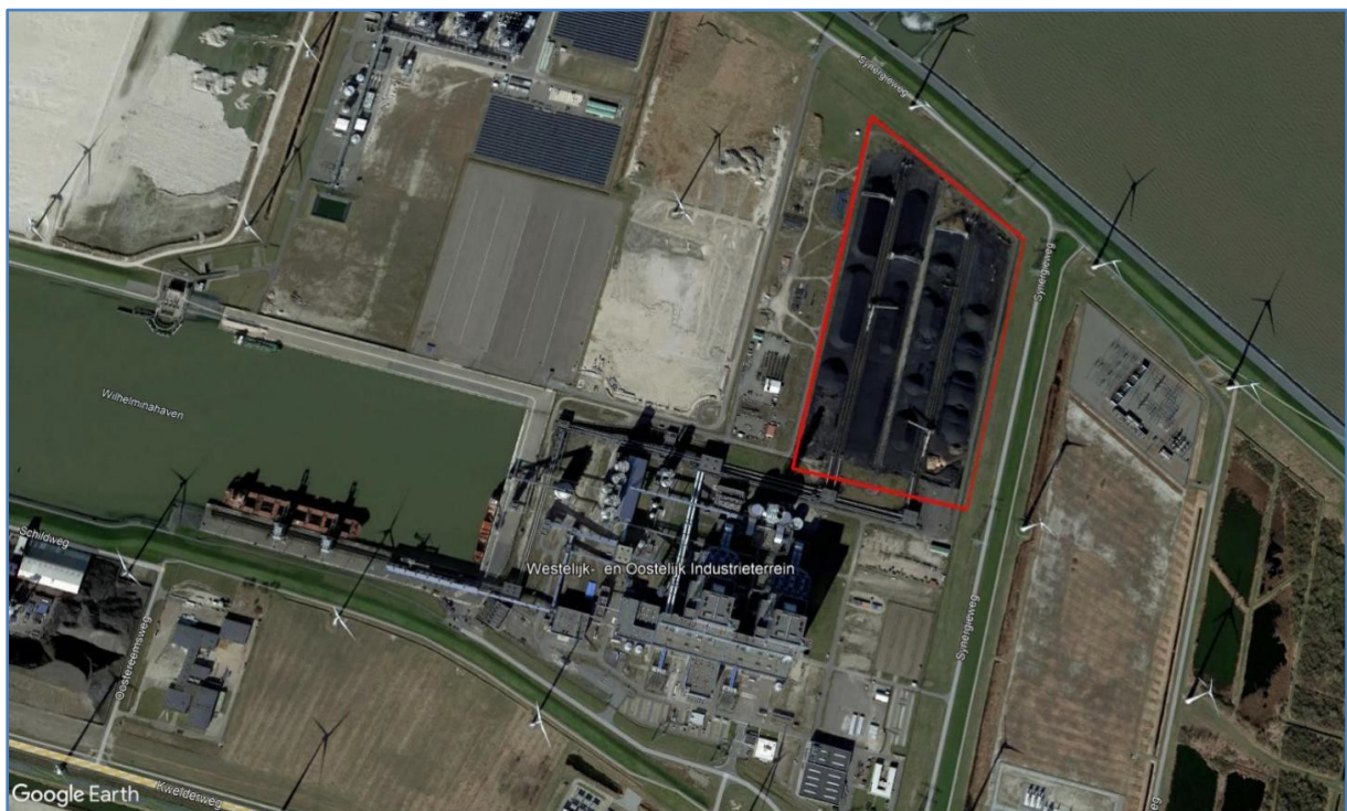
Figuur 1. Ligging kolenvelden (rode lijnen) op het terrein van de energiecentrale van RWE in de oostlob van de Eemshaven.