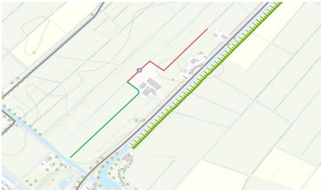
Figuur 3: De rode lijn geeft het gedeelte hoofdwaterring weer dat wordt afgewaardeerd tot schouwslot. De groene lijn geeft overgebleven hoofdwaterring Ankerdocht weer. De paarse cirkel geeft de locatie van aan te leggen dam met duiker weer.