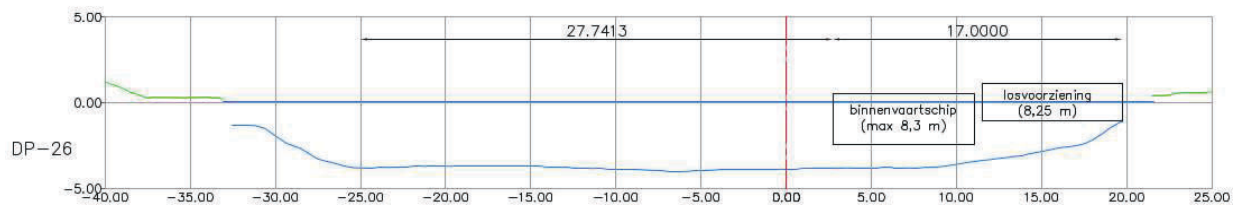
Figuur 5: Dwarsprofiel met losvoorziening en binnenvaartschip locatie Terheijden 1

Ter verduidelijking zijn in de onderstaande figuren dwarsprofielen weergegeven van alle loslocaties. Zoals in de figuren is te zien blijft op alle locaties circa 25 meter vaargeul beschikbaar voor het overige vaarverkeer.