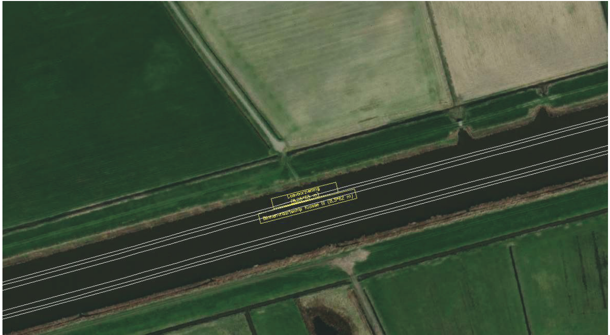
Figuur 2: Situatie primaire losvoorziening Terheijden buitengebied

In onderstaande figuren is de situatie weergegeven waarbij de losvoorziening en een binnenvaartschip van de maximale afmetingen op de boogde locatie zijn gelegen. Het overige scheepvaartverkeer zal ter hoogte van de loslocatie moeten uitwijken om de vaartuigen te kunnen passeren.