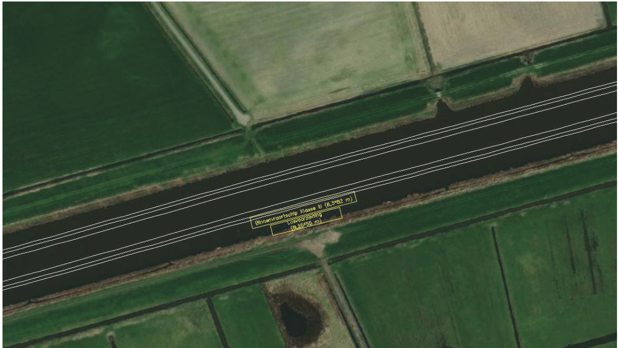
Figuur 4: Situatie primaire losvoorziening RWZI

Ter verduidelijking zijn in de onderstaande figuren dwarsprofielen weergegeven van alle loslocaties. Zoals in de figuren is te zien blijft op alle locaties circa 25 meter vaargeul beschikbaar voor het overige vaarverkeer.