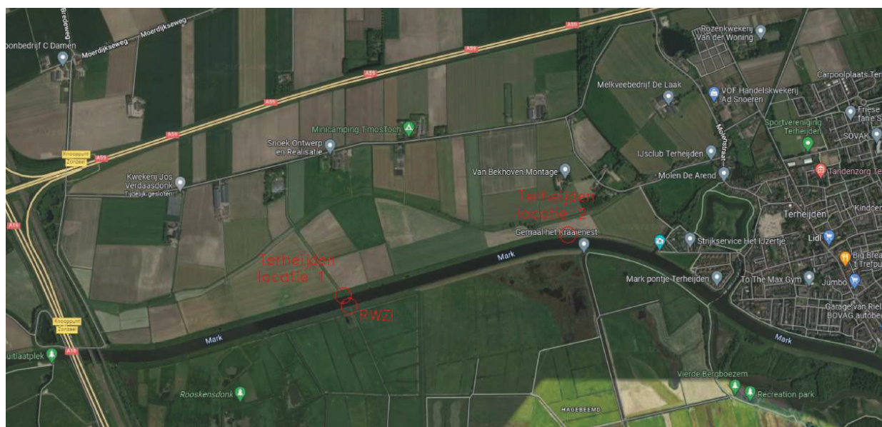
Figuur 1: Overzicht loslocaties

Voor het lossen van materiaal voor de dijkversterking van de locatie "RWZI" is loslocatie voorzien tegenover de loslocatie ten behoeve van "Terheijden buitengebied". Deze 2 loslocaties zullen nooit tegelijkertijd in werking zijn, waardoor de vaargeul nooit aan weerszijden tegelijkertijd belemmerd wordt. Op onderstaande overzichtstekening zijn de 3 locaties weergegeven: