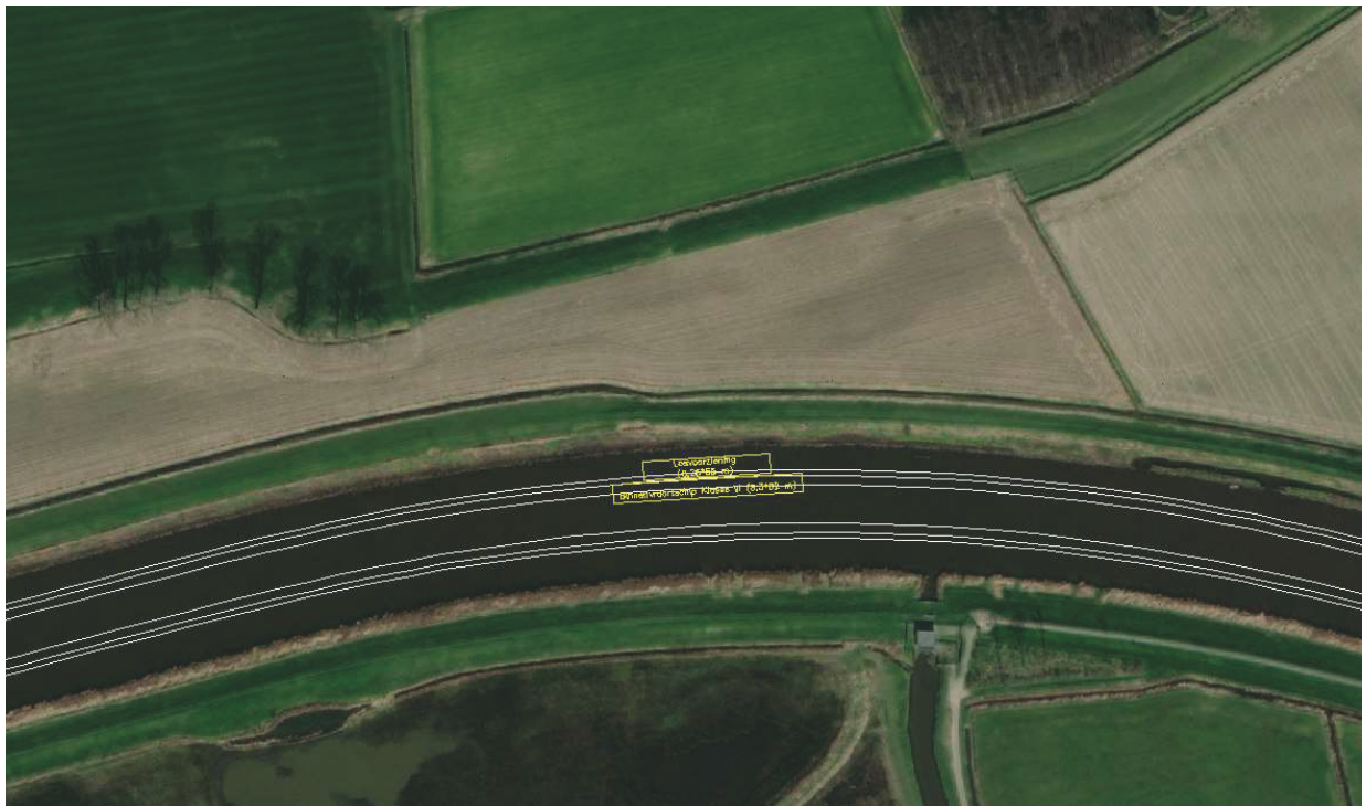
Figuur 3: Situatie optionele locatie losvoorziening Terheijden buitengebied