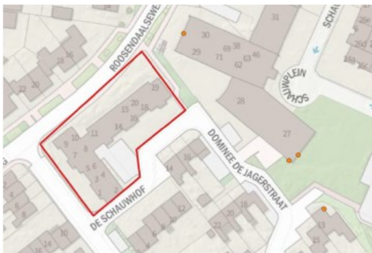
Figuur 2 Locaties waar de tijdelijke vleermuiskasten (oranje) zijn opgehangen.