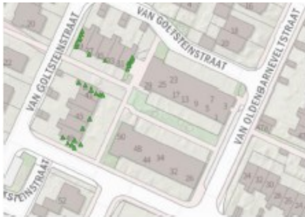
Figuur 1 Locaties waar de 27 tijdelijke nestkasten voor de huismus zijn opgehangen.