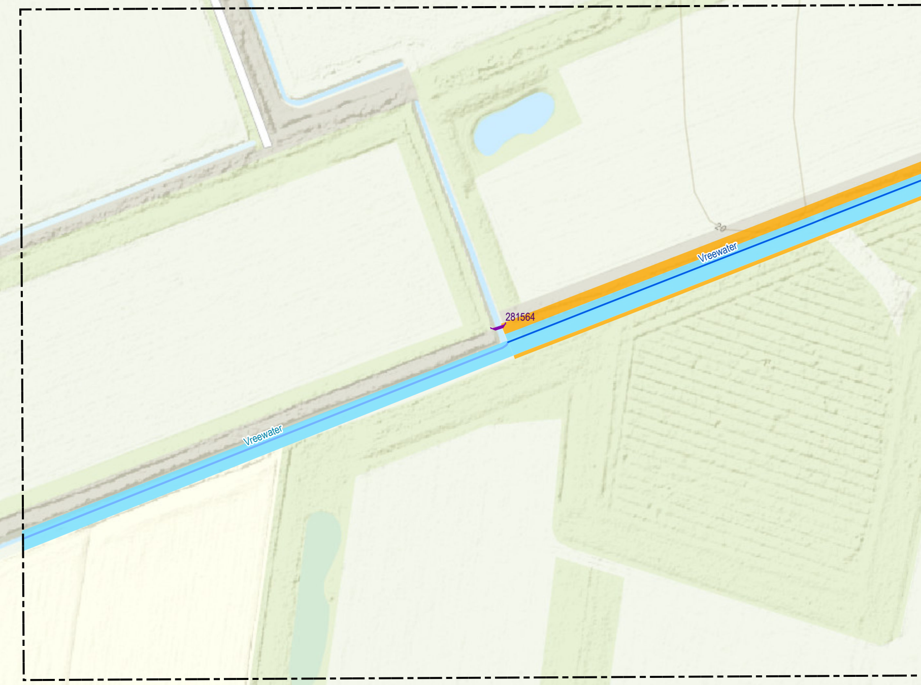
Overzichtskaatje (schaal 1:650.000)