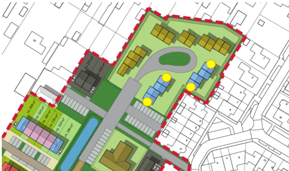
Figuur 5: Locaties permanente vlemuis voorzieningen, ter hoogte van Nieuwe Kerkstraat 61 (Buro ontwerp & omgeving, 2022).