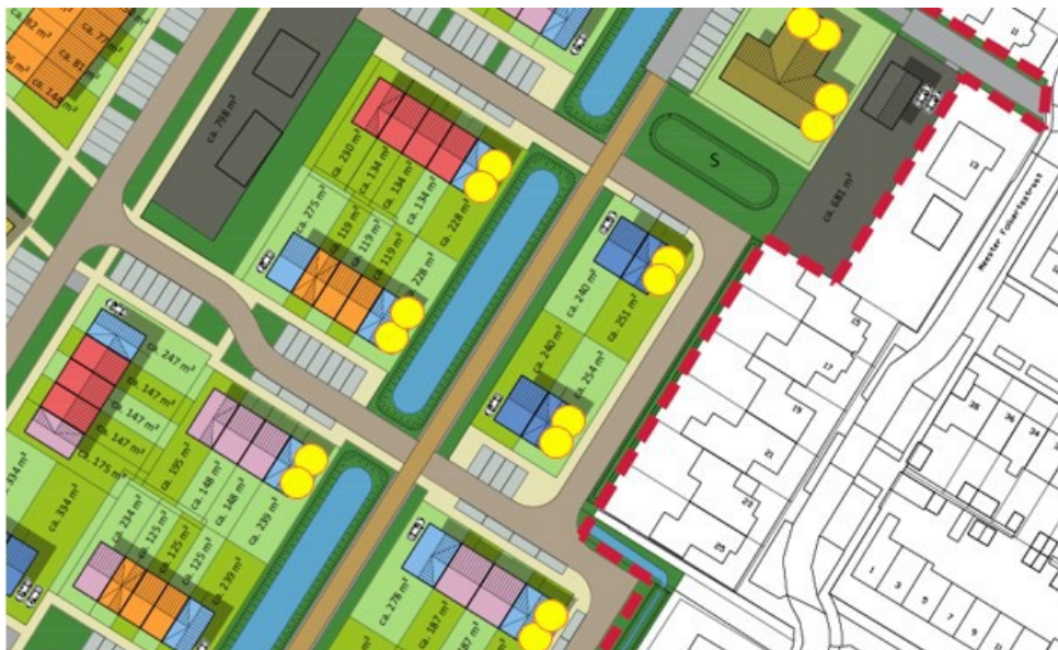
Figuur 3: Locatie permanente huismuus voorzieningen, in de omgeving van Meester Folkertstraat (Buro ontwerp & omgeving, 2022).