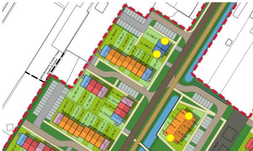
Figuur 6: Locaties permanente vleermuis voorzieningen, ter hoogte van de omgevallen oude wilg (Buro ontwerp & omgeving, 2022).