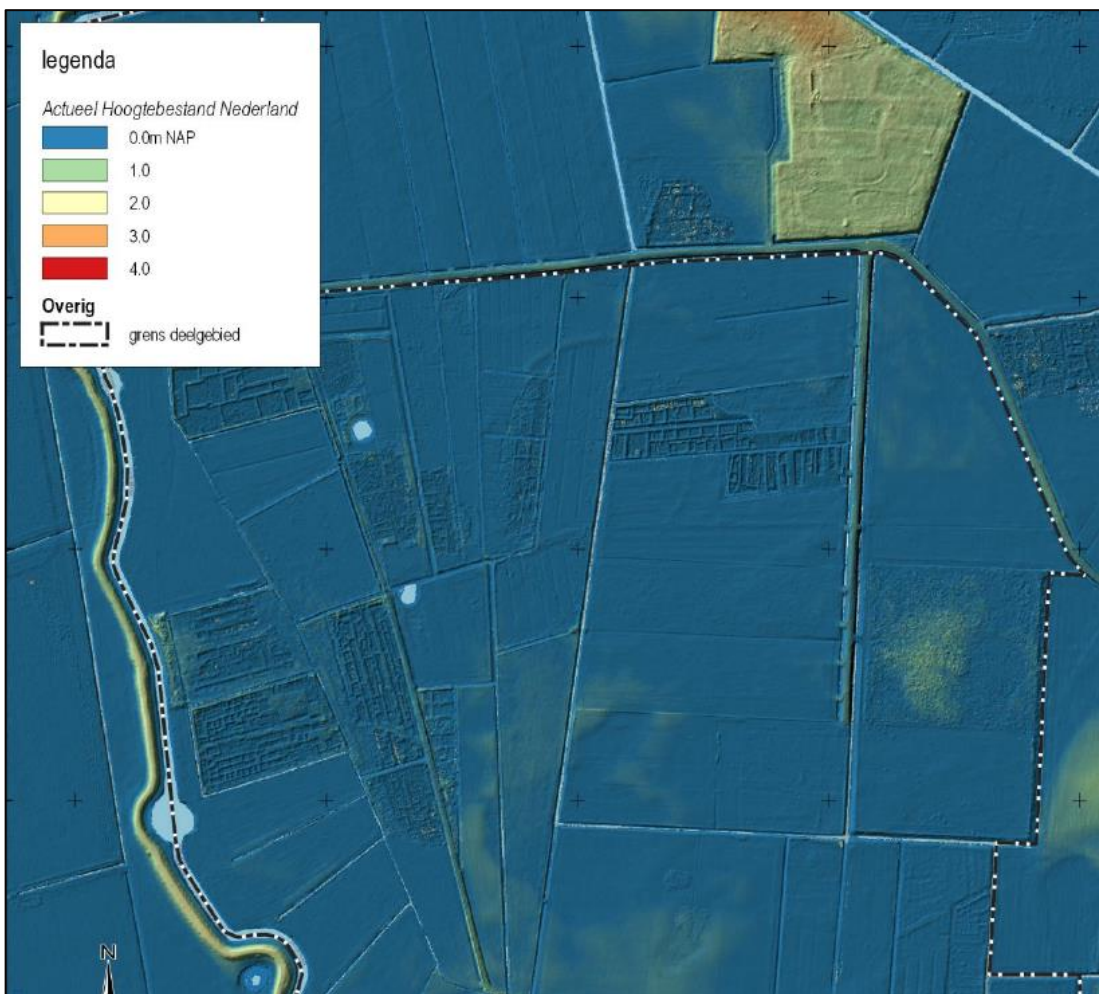
Figuur 2: hogere zandgronden in het noordoosten van Strijpen.