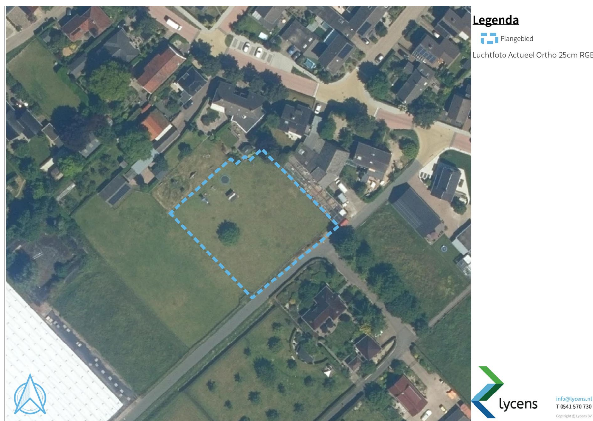
Figuur 1.2: Ligging projectlocatie

De projectlocatie is gelegen ten zuidwesten van buurtschap Het Zand. Het perceel is momenteel in gebruik als grasweide en op en rondom de kavel zijn geen beplantingen aanwezig. In figuur 1.2 en 1.3 worden de ligging en begrenzing van de projectlocatie aangegeven.