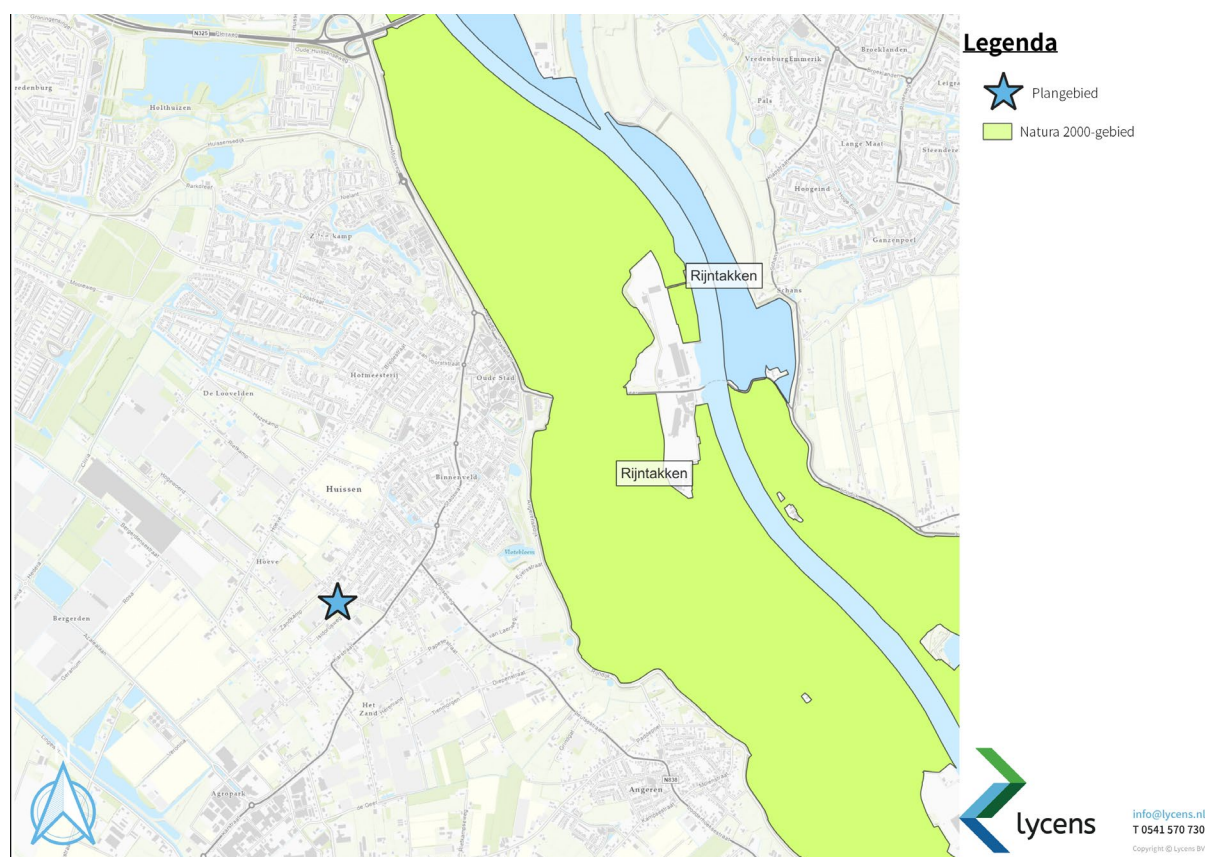
Figuur 1.3: Ligging projectgebied (blauwe ster) t.o.v. Natura-2000 gebied (lichtgroene kleur)