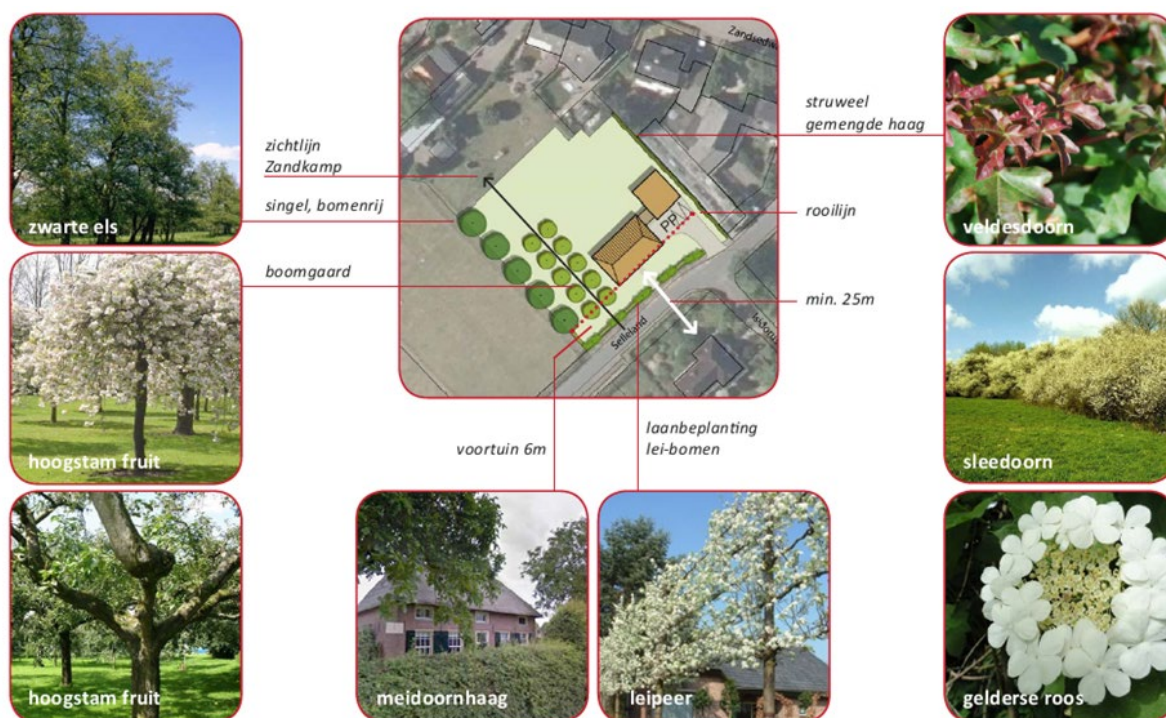
Figuur 1.1: Situatietekening beoogde situatie

De voorgenomen ontwikkeling voorziet in de bouw van een vrijstaande woningen met bijgebouw. Het plan wordt landschappelijk ingepast in de omgeving. Figuur 1.1 geeft de situatietekening van de beoogde situatie weer.