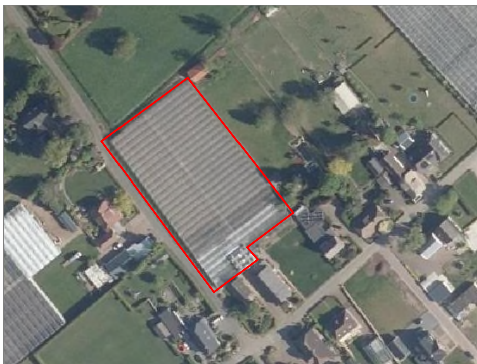
Figuur 2.2: Begrenzing van het plangebied.