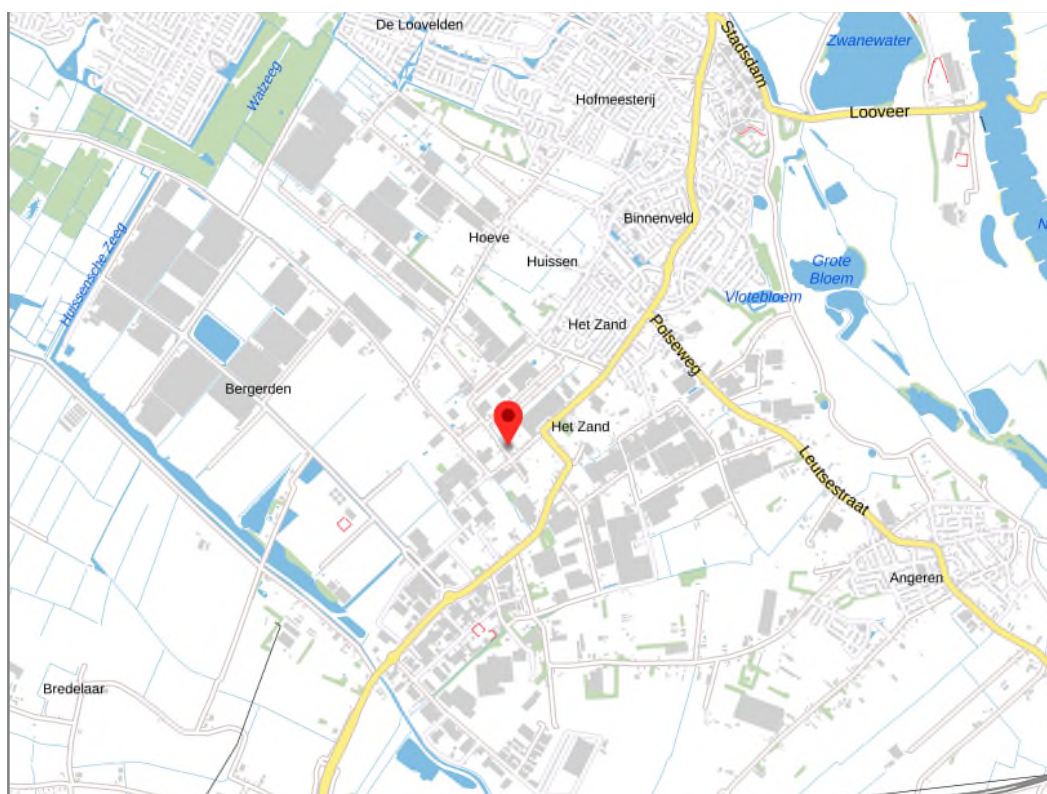
Figuur 2.1: Globale ligging van het plangebied.

Het plangebied is gesitueerd aan Nieuwediep 10 te Huissen. Het plangebied ligt in aan de rand van de woonkern Huissen en wordt omgeven door landelijk gebied. In figuur 2.1 wordt de globale ligging van het plangebied (rode marker) weergegeven op een topografische kaart.