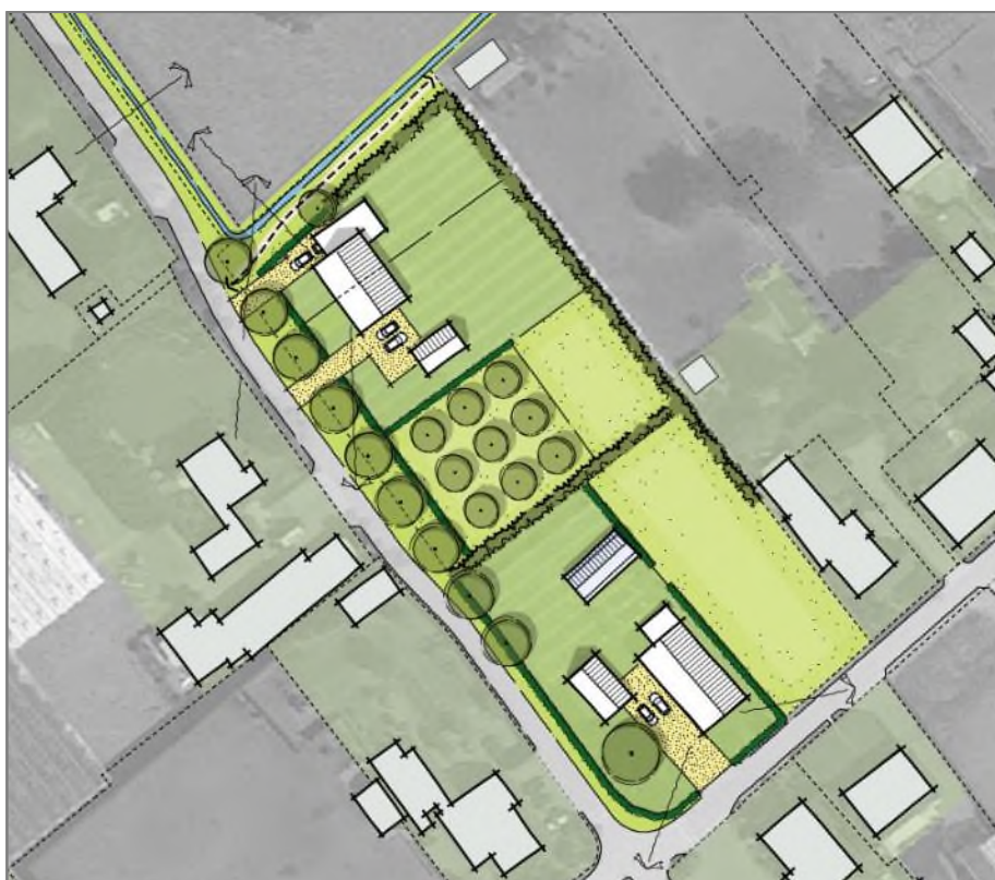
Figuur 3.1: Verbeelding beoogde situatie.

Initiatiefnemer is voornemers de bedrijfsactiviteiten te staken. Het bestaande kassencomplex wordt gesloopt voor de realisatie van twee woningen met bijgebouwen. Na de realisatie van de woning wordt verharding aangelegd en worden de erven landschappelijk ingepast door de aanplant van beplanting. Figuur 3.1 geeft de verbeelding van de beoogde situatie weer.