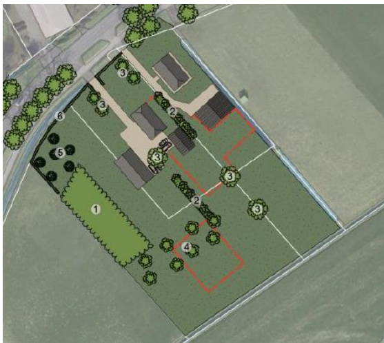
Afbeelding 3: Het plan.