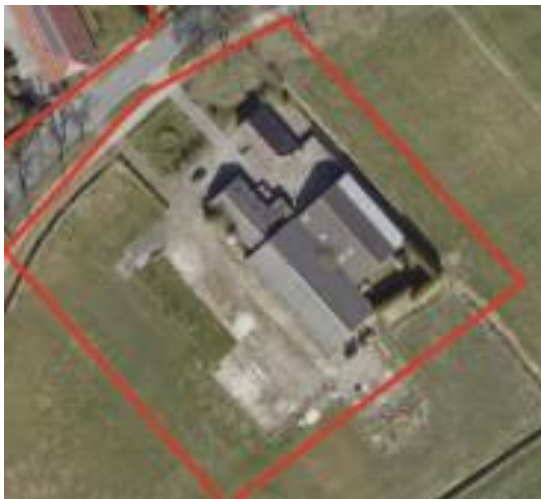
Afbeelding 1: Plangebied.

Het deel van het plangebied waarvoor dit besluit tot vaststelling hogere grenswaarde geluid is opgesteld ligt ten zuiden van de Hoogeveenseweg. In dit deel van het plangebied wordt de voormalige agrarische bebouwing gesloopt en hiervoor komen twee vrijstaande woningen terug.