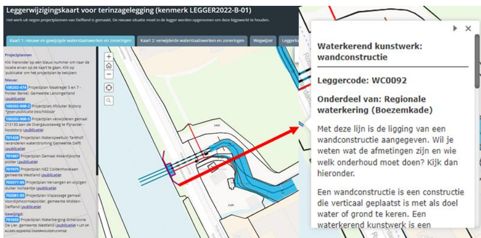
Figuur 1: Voorbeeld weergave van de interactieve leggerwijzigingskaart

Een voorbeeld van de werking van de leggerwijzigingskaart is weergegeven in Figuur 1.