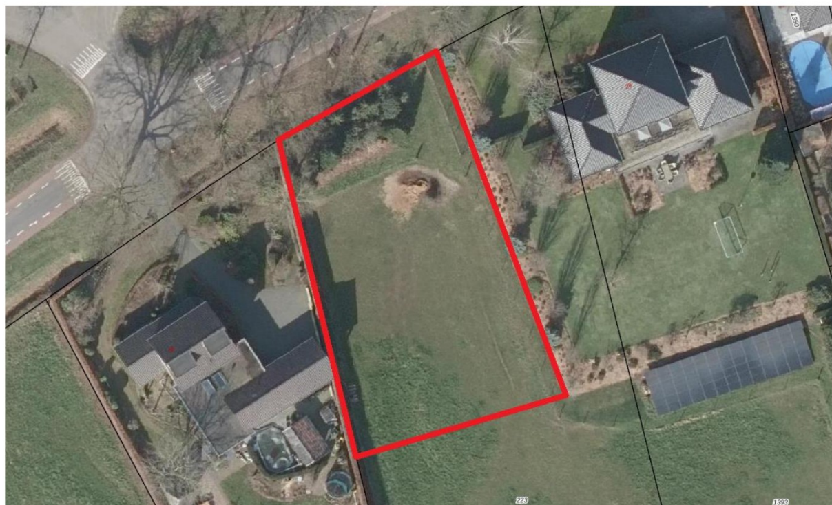
Figuur 4.1. Ligging van het plangebied (rood omlijnd).

Het plangebied bevindt zich in de noordwesthoek van het dorp Melderslo. Aan de west- en oostzijde grenzen vrijstaande woningen. Ten noorden bevindt zich de Daniëlweg met daarachter woningen. Aan de zuidzijde grenst het plangebied aan een weiland. Het plangebied zelf bestaat uit een weiland met aan de noordzijde wat opgaande vegetatie, waaronder enkele kleine naaldbomen.