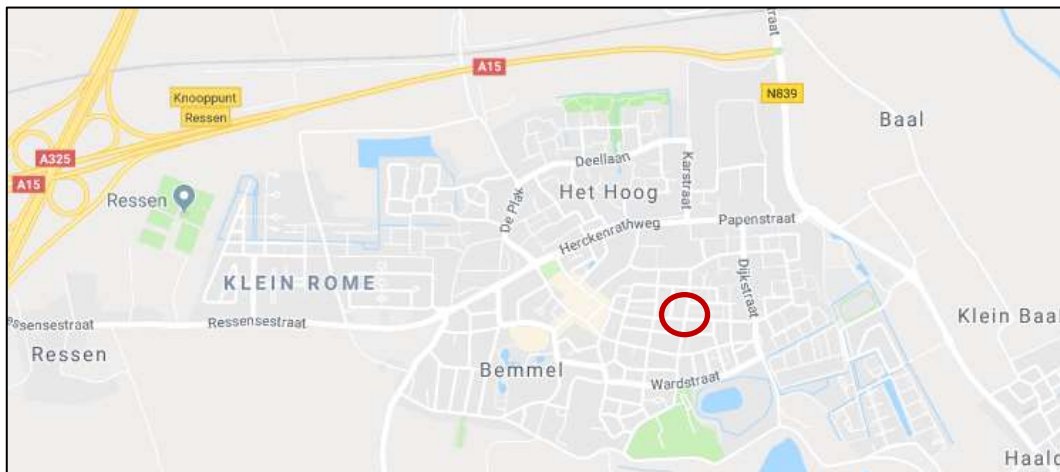
Figuur 1. Ligging van het plangebied, in rood omcirkeld.

Eerste stap in deze toetsing is het uitvoeren van een verkennend onderzoek. Op basis van een bureauonderzoek en een veldbezoek wordt aan de hand van aanwezige terreintypen en toevallige waarnemingen van soorten zo goed mogelijk ingeschat welke beschermde gebieden en plant- en diersoorten aanwezig (kunnen) zijn. Op basis daarvan worden uitspraken gedaan over de (mogelijke) effecten van de voorgenomen ontwikkeling en de eventueel noodzakelijke vervolgstappen. Voorliggende rapportage gaat hier verder op in.