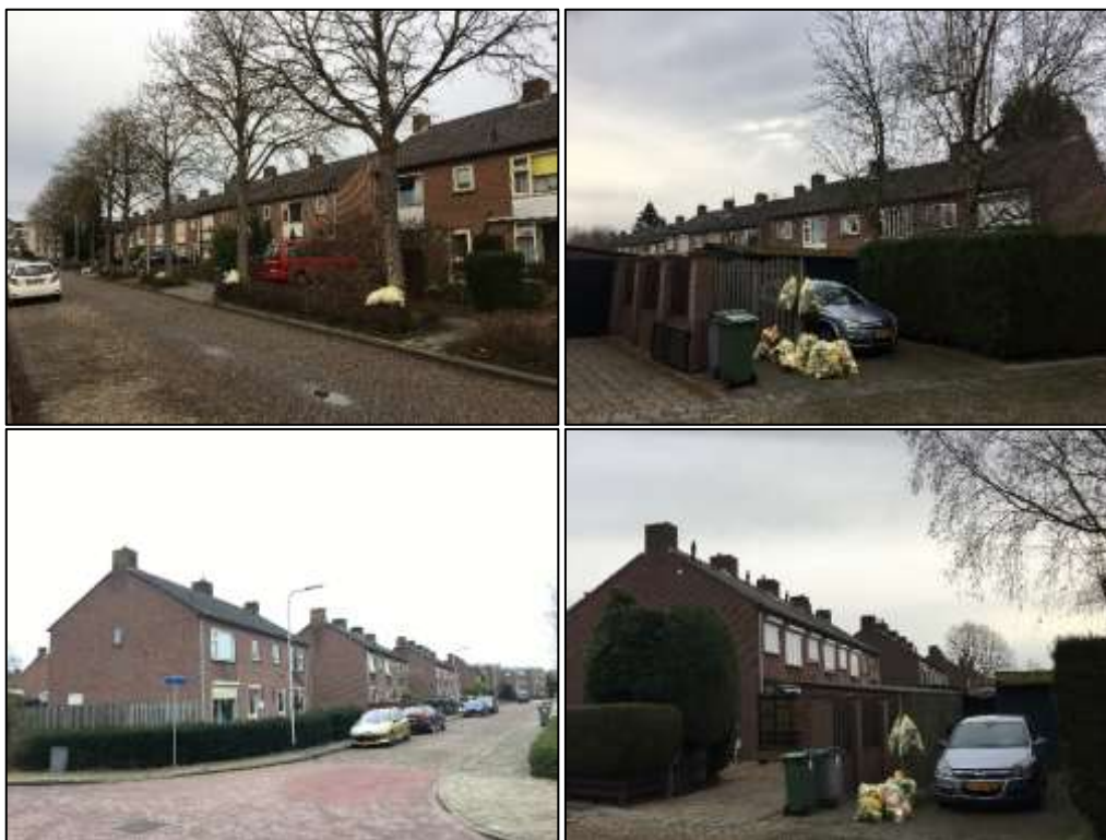
Figuur 4. Sfeerimpressie van het plangebied op 6 maart 2019. Van links boven naar rechts onder: Voorkant en achterkant van de woningen aan de Klappenburgstraat 54 t/m 76. Voorkant en achterkant van de woningen aan de Meidoornstraat 6 t/m 18. Voorkant en achterkant van de woningen aan de Klappenburgstraat 5 t/m 25. Voor en achterkant van de woningen aan de Gerard Rijssenbeekstraat 2 t/m 26.