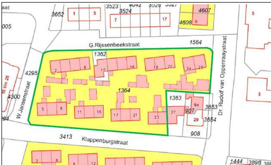
Figuur 2. Begrenzing van het plangebied Klappenburgstraat 5 t/m 25 en Gerard Rijssenbeekstraat 2 t/m 26 (in groen omlind).

De geschakelde woningen die het plangebied vormen, zijn gelegen aan de Meidoornstraat 6 t/m 18 (7 woningen), Klappenburgstraat 5 t/m 25 en 54 t/m 76 (23 woningen) en aan de Gerard Rijssenbeekstraat 2 t/m 26 (13 woningen) te Bommel, gemeente Lingewaard in de provincie Gelderland (Figuur 2). De woningen hebben pannen daken en zijn aan de voor- en achterzijde voorzien van tuinen waar verspreid begroeiing aanwezig is. Aan de voorkant van de woningen Klappenburgstraat 5 t/m 25 is een (hoge) bomenrij aanwezig. De straten worden verlicht door lantaarnpalen. In het plangebied zijn geen watervoerende elementen, zoals watergangen of een poel aanwezig (Figuur 4).