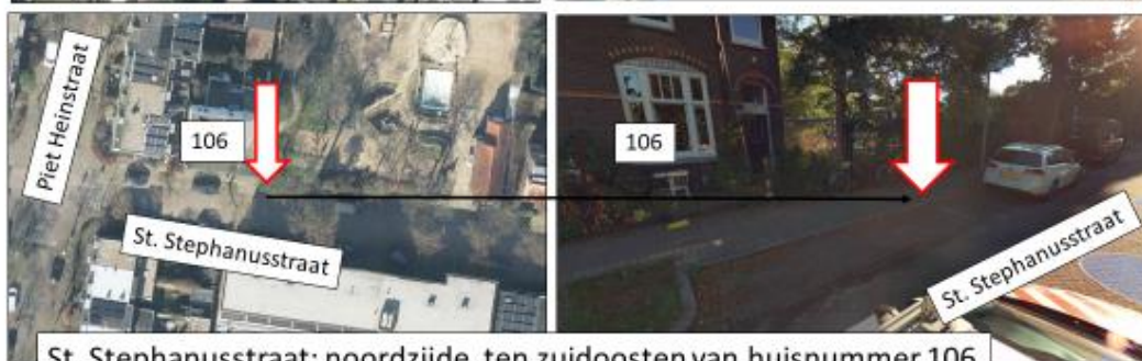
St. Stephanusstraat; noordzijde, ten zuidoosten van huisnummer 106