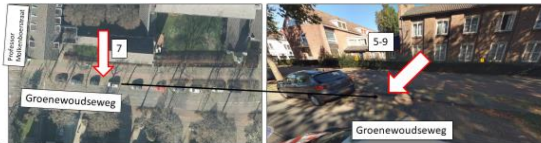
Groenewoudseweg; noordzijde, t.h.v. pand met huisnummers Professor Molkenboerstraat 5-9