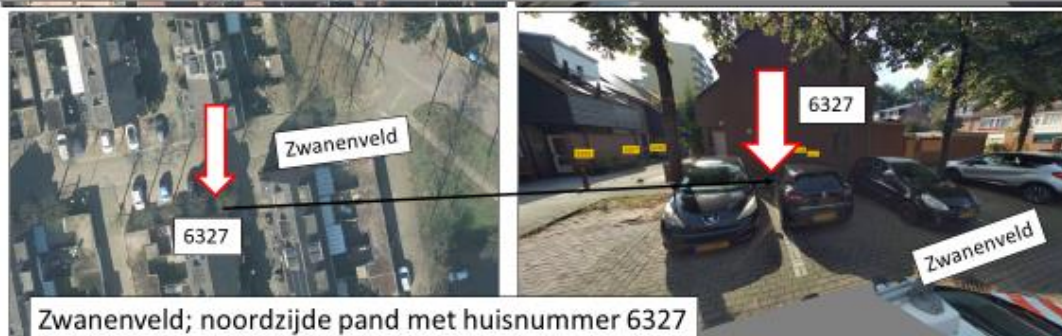
Zwanenveld; noordzijde pand met huisnummer 6327