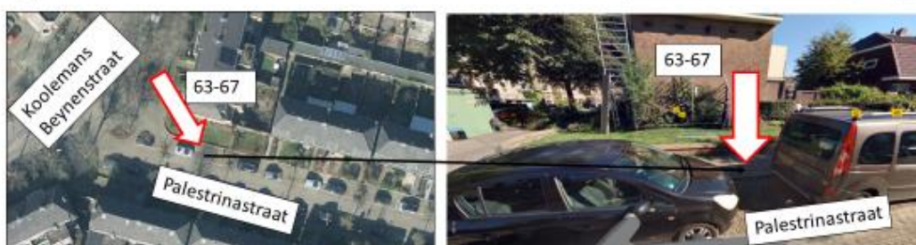
Palestrinastraat; noordzijde, ten zuiden van pand Koolemans Beynenstraat 63-67