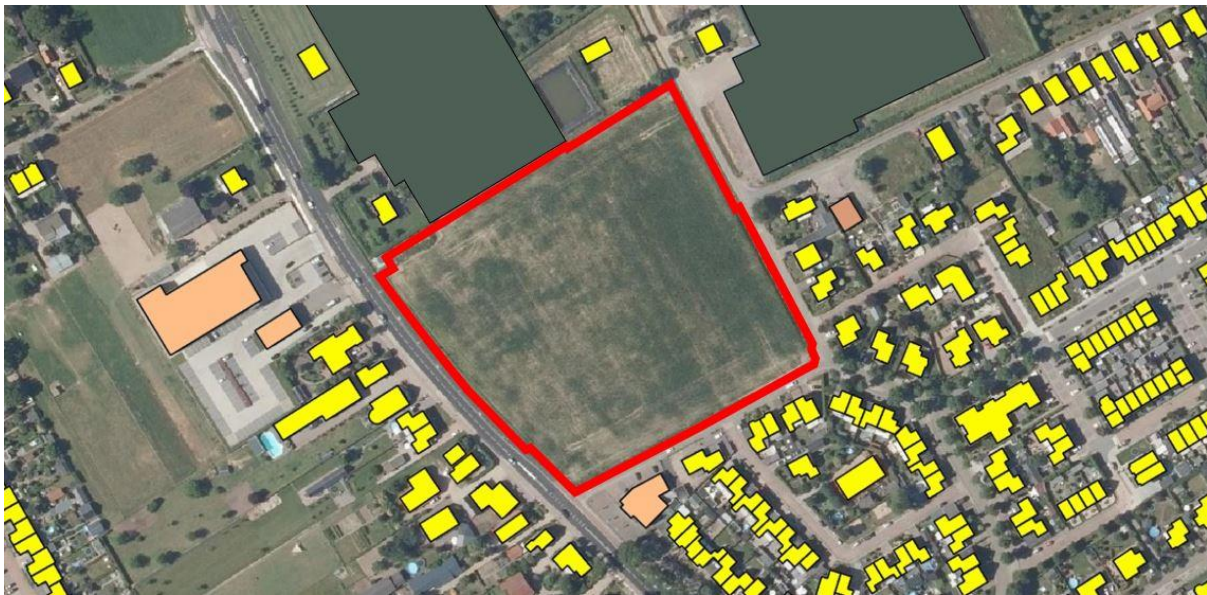
Impressie bestaande bebouwing met globale aanduiding plangebied (rode omkadering)

Het plangebied betreft een voormalige boomkwekerij. In de huidige situatie is het plangebied onbebouwd en in gebruik als agrarisch grasland. Rondom het plangebied is voornamelijk woonbebouwing gelegen. Zowel ten oosten, ten zuiden, als ten westen grenst het plangebied aan de kern Haalderen. De voormalige agrarische glastuinbouwbedrijven ten noorden en ten noordoosten van het plangebied, aan de Van der Mondeweg 82 en de Lage Zandsestraat 24, zijn beëindigd. Op basis van het functieveranderingsbeleid voor het buitengebied zijn op beide percelen de voormalige kassen gesloopt om, naast de te handhaven bestaande bedrijfswoningen, op ieder perceel twee nieuwe woningen te bouwen. Op navolgende afbeelding is een impressie van de omliggende bestaande bebouwing weergegeven: