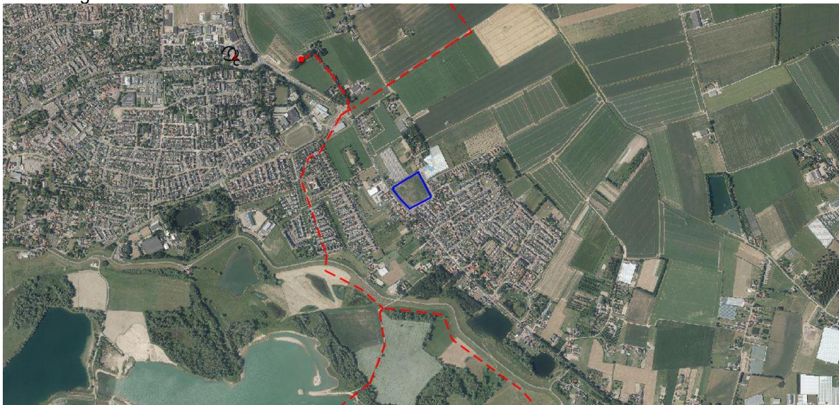
Uitsnede risicokaart met globale begrenzing plangebied (blauwe omkadering)

Op navolgende afbeelding is een uitsnede weergegeven van de provinciale risicokaart. Hierop is informatie weergegeven ten aanzien van inrichtingen met gevaarlijke stoffen, transportroutes en buisleidingen: