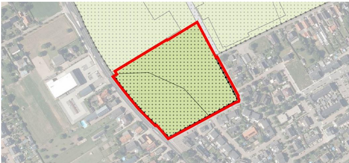
Uitsnede geldend bestemmingsplan met globale aanduiding plangebied (rode omkadering)

De watergangen langs de oost- en westzijde hebben de bestemming 'Water' op grond van het geldende bestemmingsplan 'Kom Haaldere', zoals vastgesteld door de gemeenteraad op 7 februari 2012. Aan de westzijde wordt de watergang gedempt ten behoeve van de aanleg van een fietspad. Aan de oostzijde van het plangebied is de watergang niet opgenomen in het voorlopige ontwerp, maar dient deze wel (gedeeltelijk) in stand gehouden te worden of de waterberging dient gecompenseerd te worden. Zodoende krijgen de binnen het plangebied gelegen gedeeltes van deze watergangen in het onderhavige bestemmingsplan een verkeersbestemming, waarbinnen zowel water, als verkeersvoorzieningen zijn toegestaan.