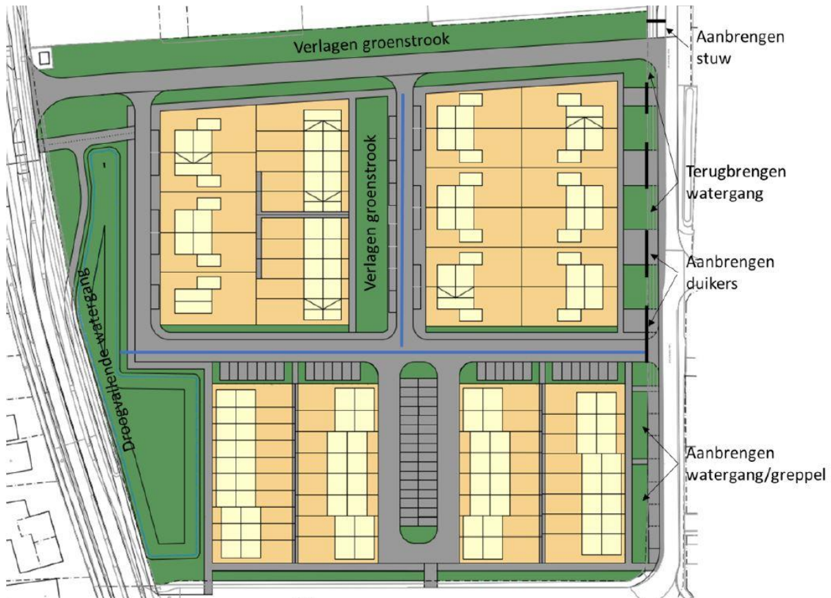
Schematisch overzicht watersysteem

Het vuilwater wordt gescheiden afgevoerd naar het bestaande gemeentelijk vuilwaterstelsel aan de zuidzijde van het plangebied.