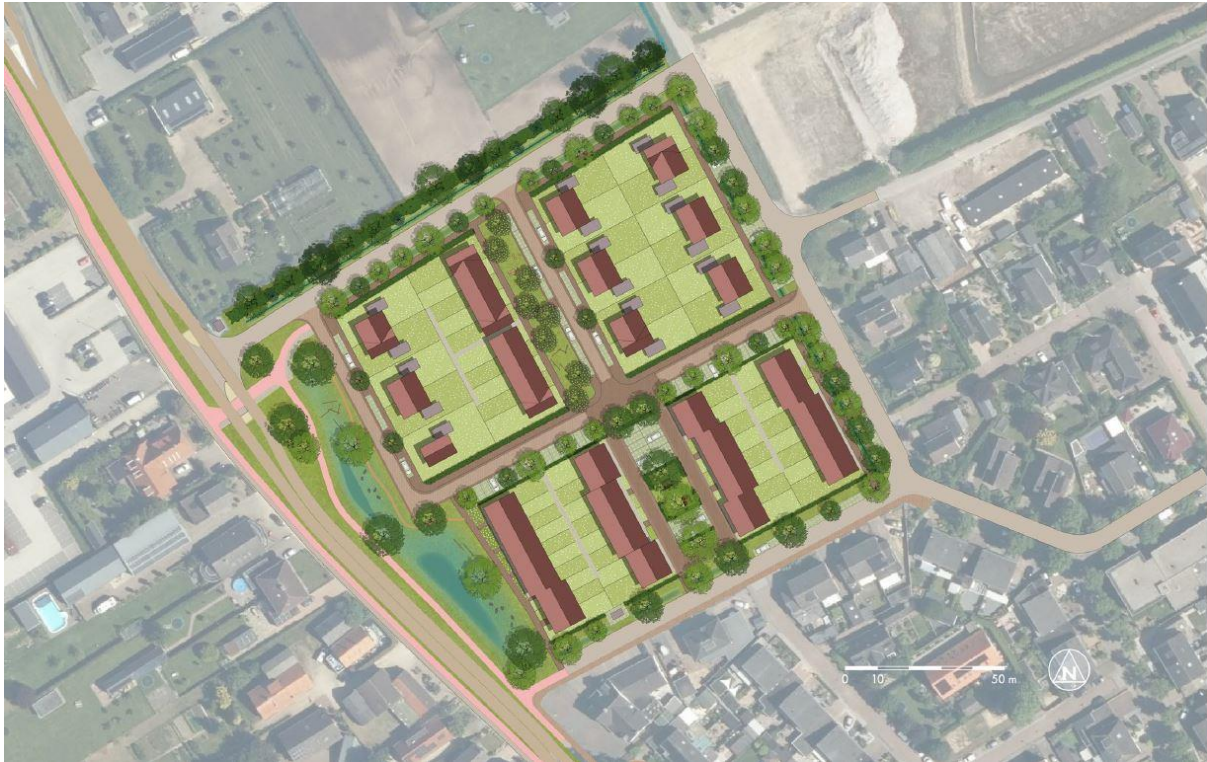
Stedenbouwkundige opzet 't Hof van Klein Baal