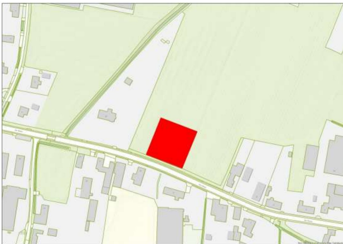
Afbeelding 1 - beoogde locatie woningbouw

Voor dit perceel tussen De Hees 12 en 20 bestaat het voornemen twee woningen te realiseren. Zie onderstaande afbeelding.