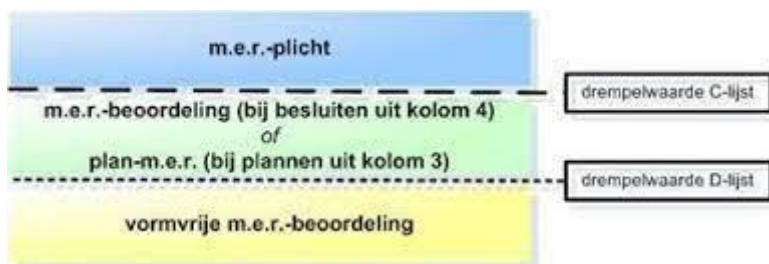
Figuur 2.1 Toetsing van activiteiten aan de drempelwaarden in de C- en D-lijst van het Besluit milieueffectrapportage

De wettelijke eisen ten aanzien van een m.e.r.-procedure zijn vastgelegd in de Wet milieubeheer en het Besluit milieueffectrapportage. In deze documenten wordt een onderscheid gemaakt tussen activiteiten die m.e.r.-plichtig zijn (zogenaamde C-activiteiten) en activiteiten die m.e.r.-beoordelingsplichtig zijn (zogenaamde D-activiteiten). In onderstaande afbeelding is de werking van de toetsing van activiteiten aan de drempelwaarden in de C- en D-lijst van het Besluit m.e.r. schematisch weergegeven.