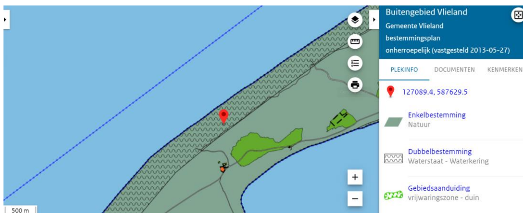
Afbeelding 2 Uitsnede bestemmingsplan

De locatie bevindt zich binnen bestemmingsplan "Buitengebied Vlieland", zoals vastgesteld op 27 mei 2013 door de gemeente Vlieland. De locatie heeft een enkelbestemming 'Natuur', dubbelbestemming 'Waterkering' en een gebiedsaanduiding 'Vrijwaringszone duin'.