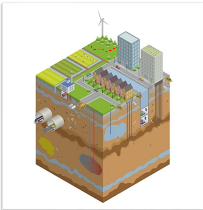
Enkele (algemene) voorbeelden van ondergrondse activiteiten en hun samenhang

Een praktisch voorbeeld hiervan is dat we kaartlagen met ondergrondse infrastructuur, bodemkwaliteit, grondwaterstanden en mijnverleden 'over elkaar heen leggen'. Dit is zeer bruikbare informatie om bijvoorbeeld leidingtrajecten te bepalen of om te bezien hoe de fundering van bouwprojecten het beste kan worden uitgevoerd.