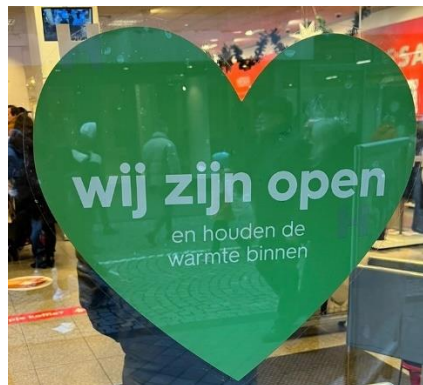
Een open inrichting

Naast de controlerende taak hebben de toezichthouders ook een adviserende taak. Sommige zaken zijn niet wettelijk verplicht, maar kunnen wel een groot voordeel opleveren in het kader van energiebesparing. De toezichthouders benoemen deze aspecten en adviseren ondernemers over bijvoorbeeld het gesloten houden van winkeldeuren als de verwarming of airco aan staat.