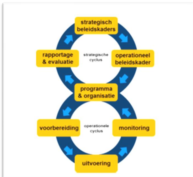
De 'Big-8' waarin de verbinding gemaakt wordt tussen beleid en uitvoering

Het VTH-beleid vormt het fundament voor de uitvoering. In het Vergunningen- en Handhaving uitvoeringprogramma (VUP en HUP) beschrijven we welke soorten en aantallen we programmeren voor een jaar. Op basis van kwartaal- en jaarrapportages evalueren we de uitvoering en dit leidt tot een tussentijdse bijsturing van het VUP of HUP en/of nieuwe input voor de volgende versie van het VTH-beleid. Daarmee wordt de 'big 8' oftewel de beleids/uitvoeringscyclus gesloten.