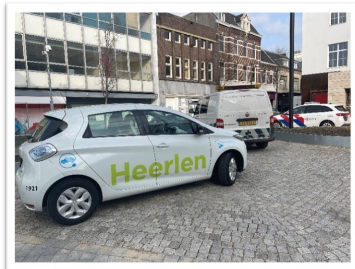
Sfeerbeeld van het vertrekmoment naar een integrale controle in samenwerking met ILT en Politie.

Zowel bij programmatisch als niet-programmatisch zoeken we, indien daar aanleiding toe is, actief ons interne en externe netwerk op. Dat betekent dat als we signalen hebben die duiden op ondermijning, illegale afvalverwerking of -transporten of anderszins illegale activiteiten waar we vanuit Omgevingsrecht geen bevoegdheden hebben, we deze zaken doorgeven aan de teams en instanties die hier wél tegen kunnen optreden. Voorbeelden zijn Team SV&B, Team Toezicht en Team Handhaving, Inspectie Leefomgeving en Transport en de Politie. Zie ook C.6.2.