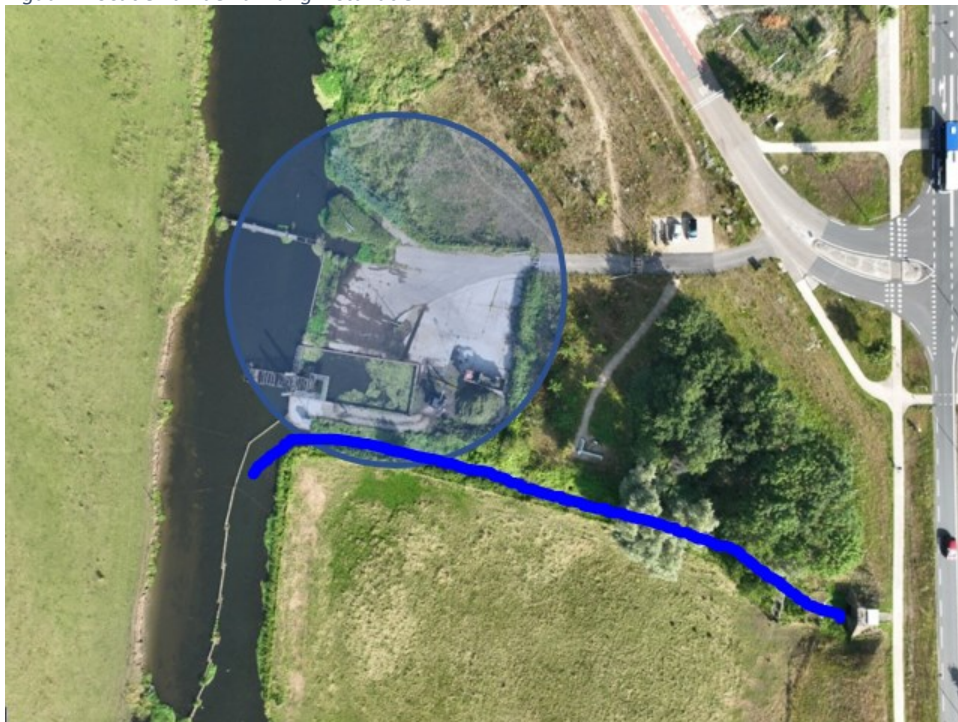
Figuur 2: Bovenaanzicht vuilvang en kroonbeek