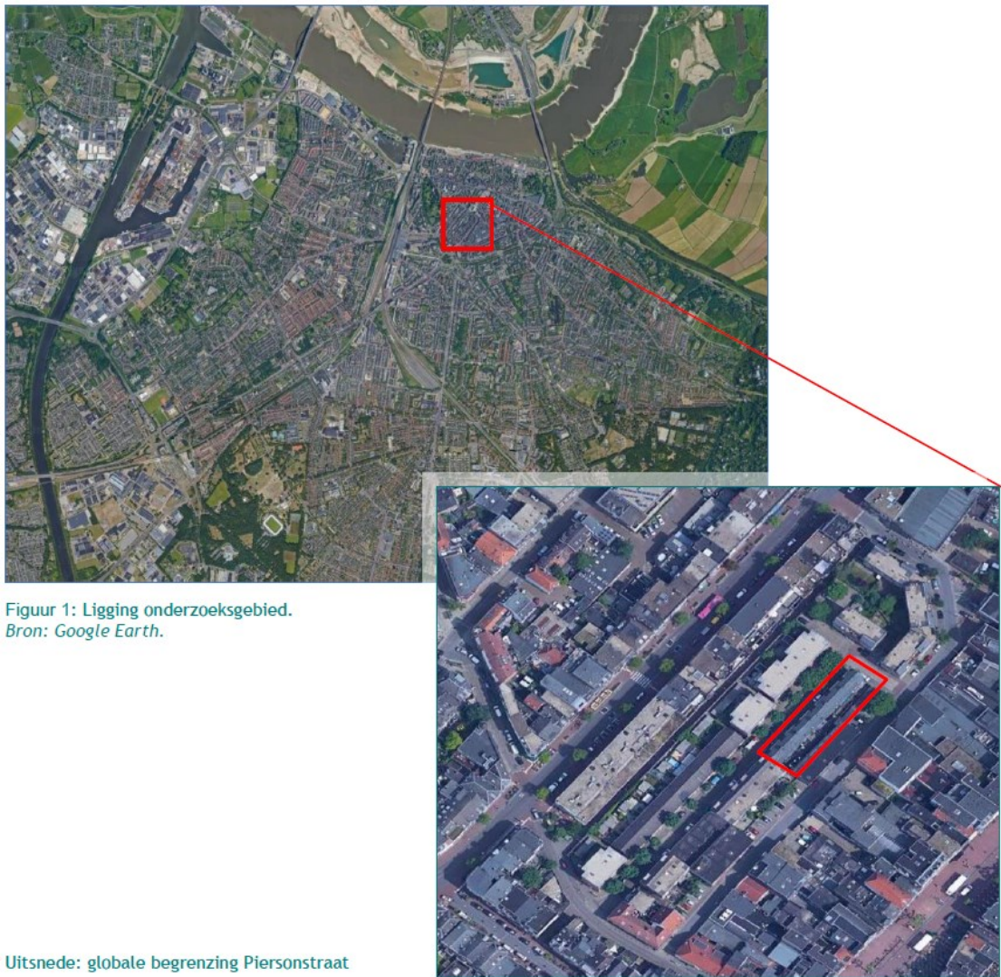
Figuur 1: Ligging onderzoeksgebied.

Uitsnede: globale begrenzing Piersonstraat