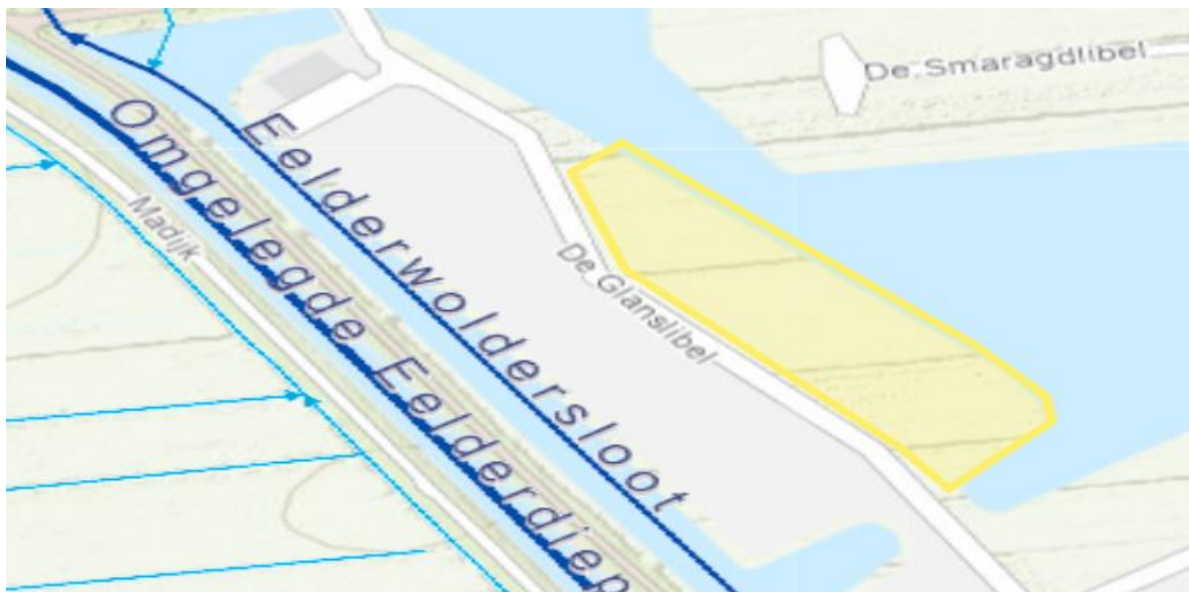
Figuur 1: Projectlocatie weergegeven als geel vlak.

Het dagelijks bestuur van het waterschap Noorderzijlvest heeft op 11 januari 2023 van een aanvraag ontvangen om een vergunning als bedoeld in hoofdstuk 6 van de Waterwet (Wtw). De aanvraag betreft het plaatsen van acht steigers in een watergang achter de nieuw te bouwen woningen aan De Glanslibel 1 t/m 15 (oneven nummers) te Eelderwolde, zoals hieronder globaal is weergegeven in figuur 1 en 2.