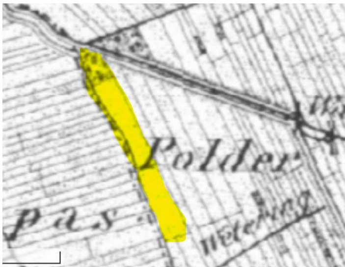
Figuur 1 Historische kaart uit 1850 met in geel het desbetreffende perceel. De watergang was in 1850 nog niet aanwezig

De demping tast het agrarisch cultuurlandschap niet onaanvaardbaar aan. Op de historische kaart van 1850 is de te dempen watergang niet aanwezig, zie figuur 1. Dit betekent dat te dempen watergang geen onderdeel is van het twaalfde-eeuwse cope-ontginningsstelsel. Het verdwijnen van deze watergang zal daarmee geen afbreuk doen aan de structuur van het cope-ontginningsstelsel