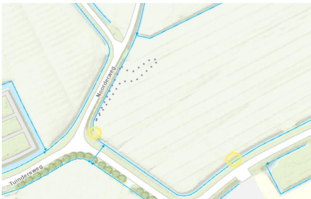
Figuur 2: Gewenste dammen met duikers weergegeven met gele cirkels, te graven waterberging weergegeven binnen de parse stippellijn.