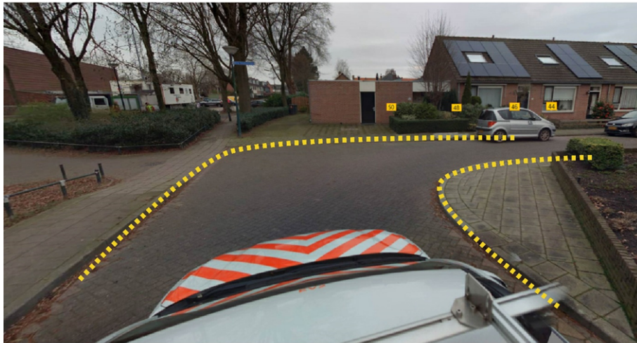
Burg. Goudsmitlaan, Bovenpad