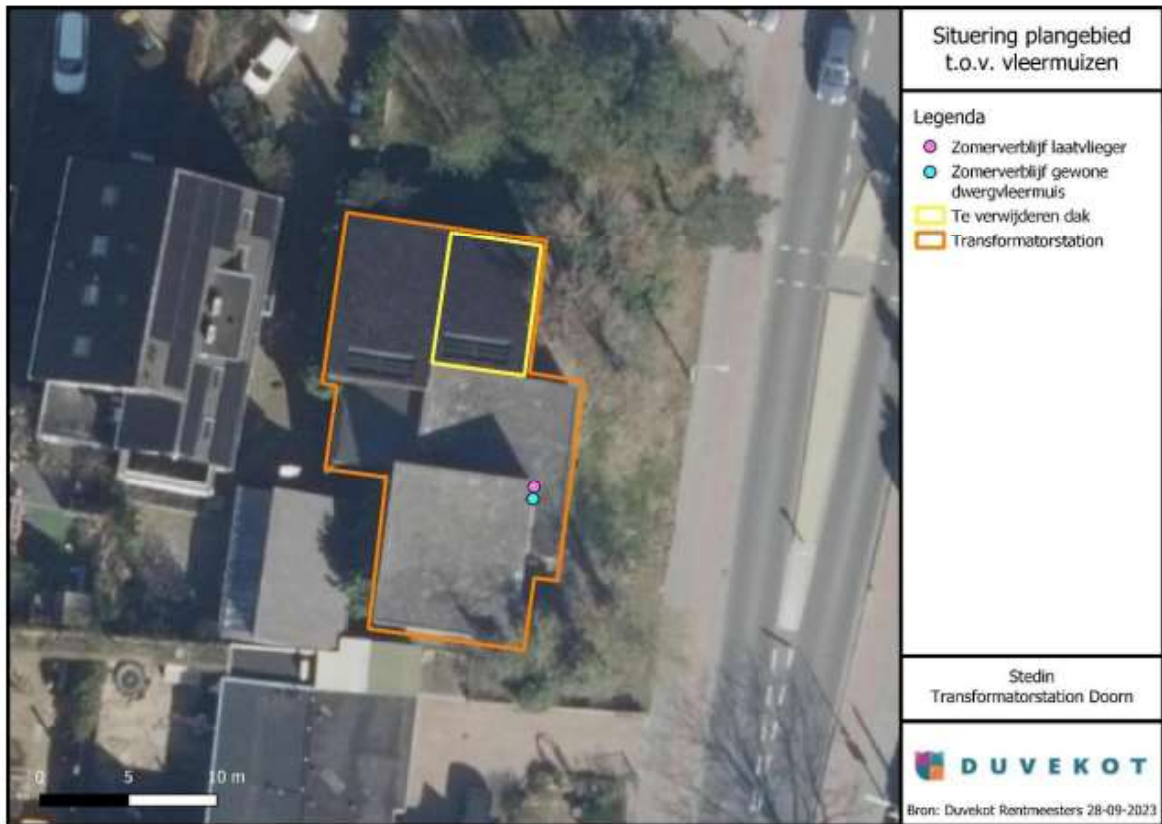
Figuur 1. Locatie plangebied met aanwezige verblijfplaatsen van de gewone dwergvleermuis en de laatvlieger