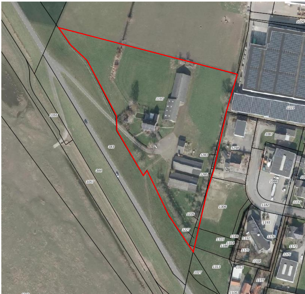
Afbeelding. 2. Begrenzing van het plangebied.