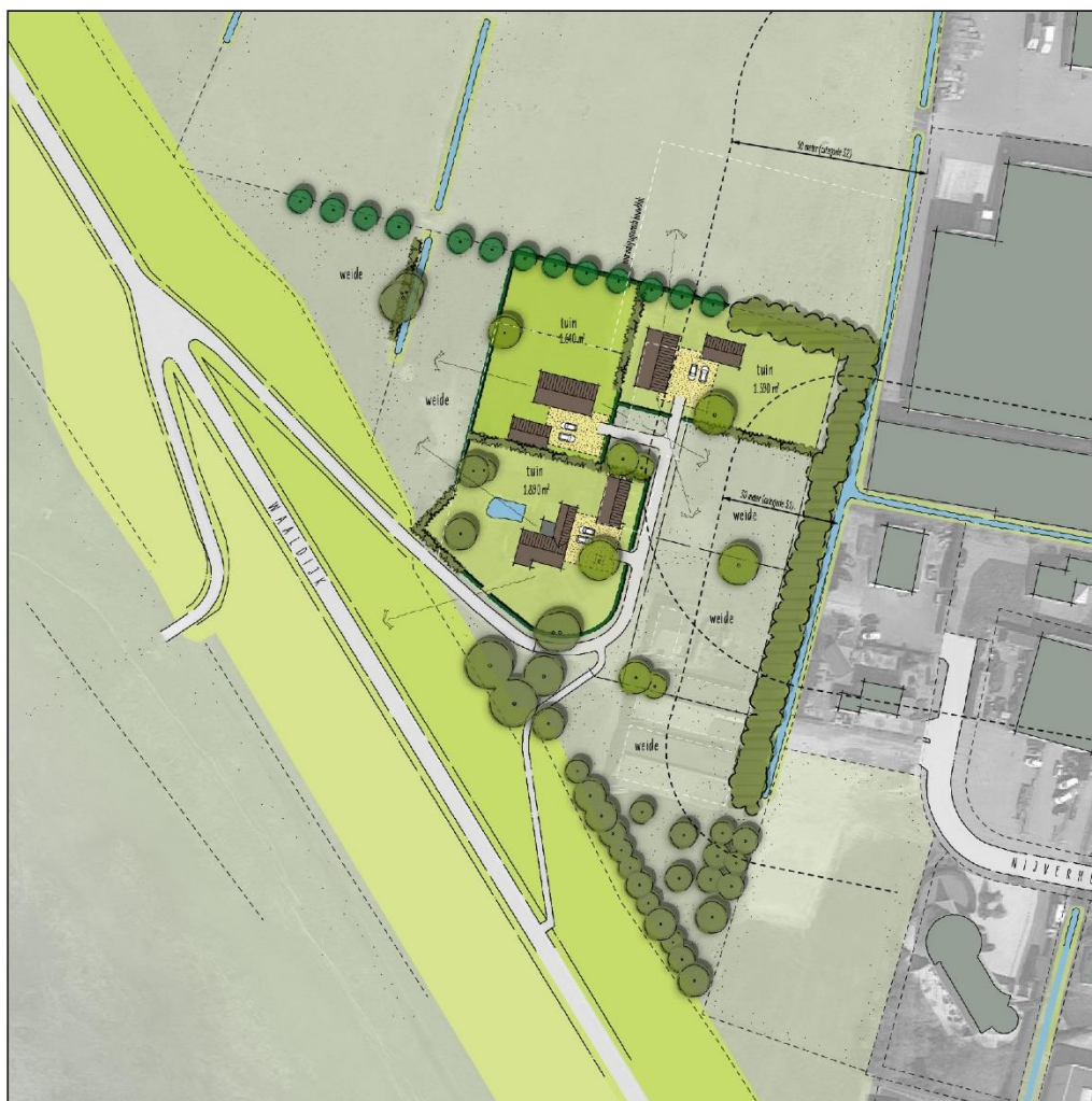
Afbeelding. 3. Verbeelding van het wenselijke eindbeeld.

De volgende activiteiten worden getoetst op relevantie t.a.v. de Wet natuurbescherming: