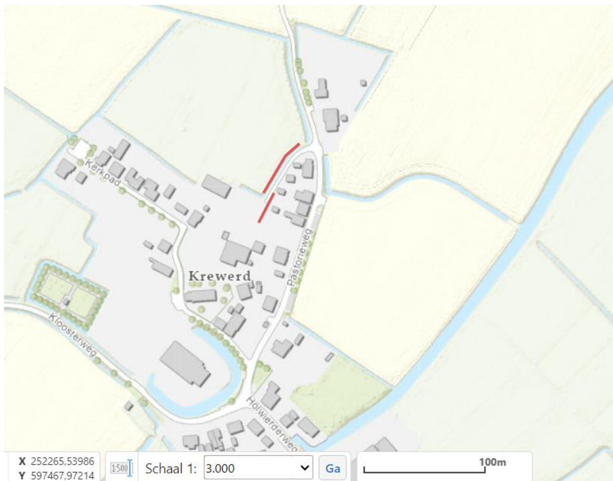
Figuur 2: Schematische tekening van de werkzaamheden. De rode lijnen geven globaal de locaties weer van de tijdelijk te dempen secundaire watergangen.

De vergunningaanvraag is bij waterschap Noorderzijlvest geregistreerd onder het zaaknummer Z/23/065463 en omvat de volgende voor dit besluit relevante stukken: