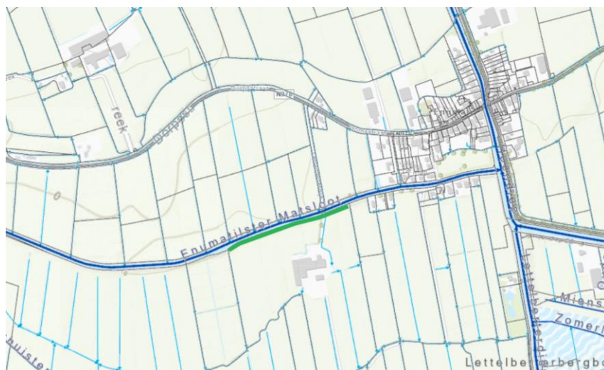
Figuur 1: Overzicht plangebied

De aan te passen oever bevindt zich aan de zuidzijde van de Enumatilstermatsloot in de omgeving van Enumatil. Met de vrijkomende grond uit de oever en de (ingedroogde) bagger wordt de regionale kering weer in profiel en op hoogte gebracht, hiermee komt het waterschap tegemoet aan de wens van de perceel eigenaar om een NVO te realiseren. De locatie is in onderstaande figuur weergegeven.