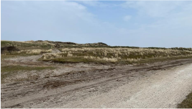
Zicht vanuit zuidkant ingang Wn12H