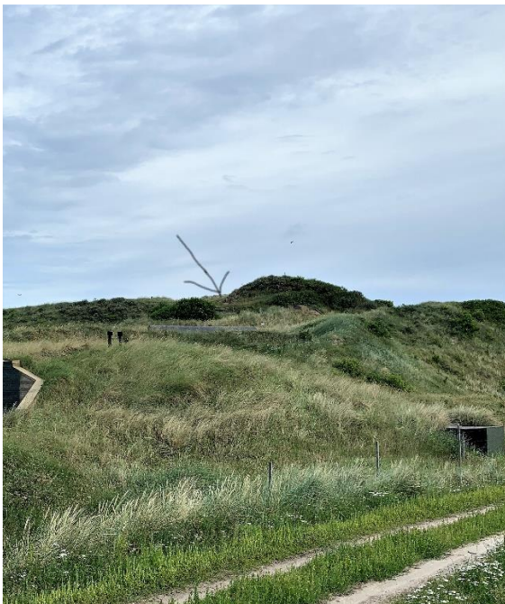
Airco buitenunit Oost

In februari 2022 zijn er vier airco's in de bunkers te geplaatst. Deze airco's hebben een binnen en buiten unit. De buitenunits zijn van een gecamoufleerde ombouw voorzien en zoveel mogelijk in het terrein opgenomen. Vanaf het fietspad zijn de units niet zichtbaar. Onderstaande foto's geven een impressie van de ruimtelijke inpassing.