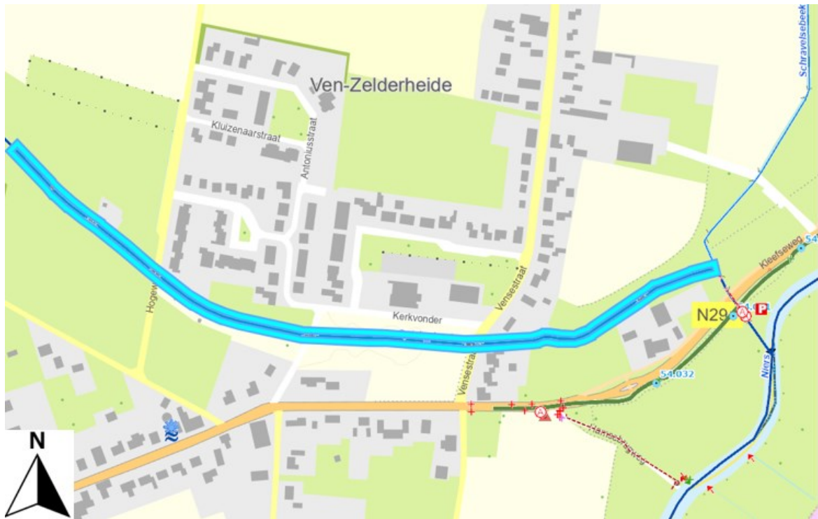
Figuur 1: Plangebied omtrent incorrect verhang beekbodem Spiekerbeek