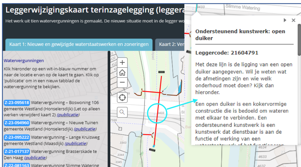
Figuur 1: Voorbeeldweergave van de interactieve leggerwijzigingskaart