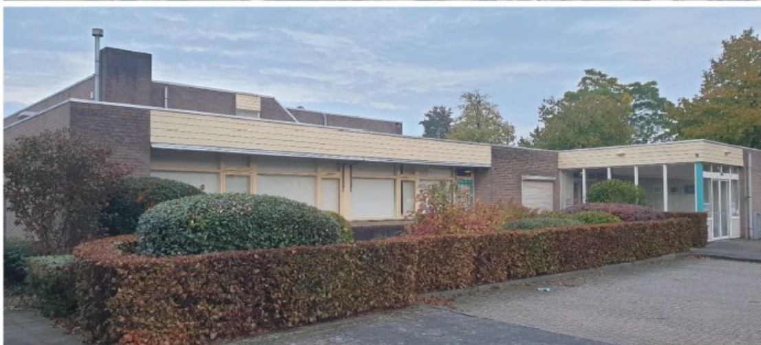
Figuur 1 Planetenstraat 30 te Nijmegen in bovenaanzicht (rood omlijnd boven) en gezien vanaf de voorkant (onder)