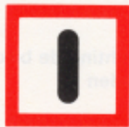
Verplichting bijzonder op te letten (BPR, bijlage 7, B.8 )