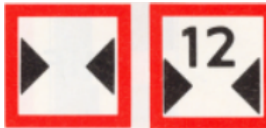
Beperkte breedte van doorvaart of vaarwater; eventueel de beschikbare breedte aangegeven in meters (BPR, bijlage 7, C.3 )

Aan de vaartuigen welke worden gebruikt bij de kadeverbetering moet eveneens de juiste bebording worden bevestigd. Het afgesloten deel van de vaarweg moet ook fysiek, doormiddel van bijvoorbeeld een ballenlijn, worden afgesloten.