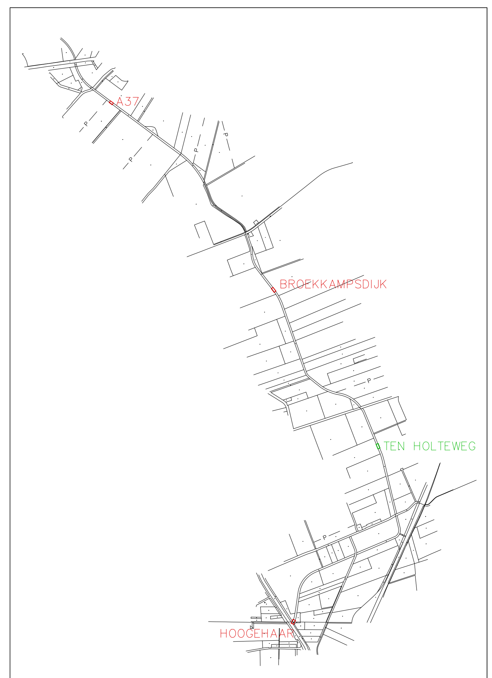
OVERZICHTSKAART LOODIEP SCHAAL 1:2000