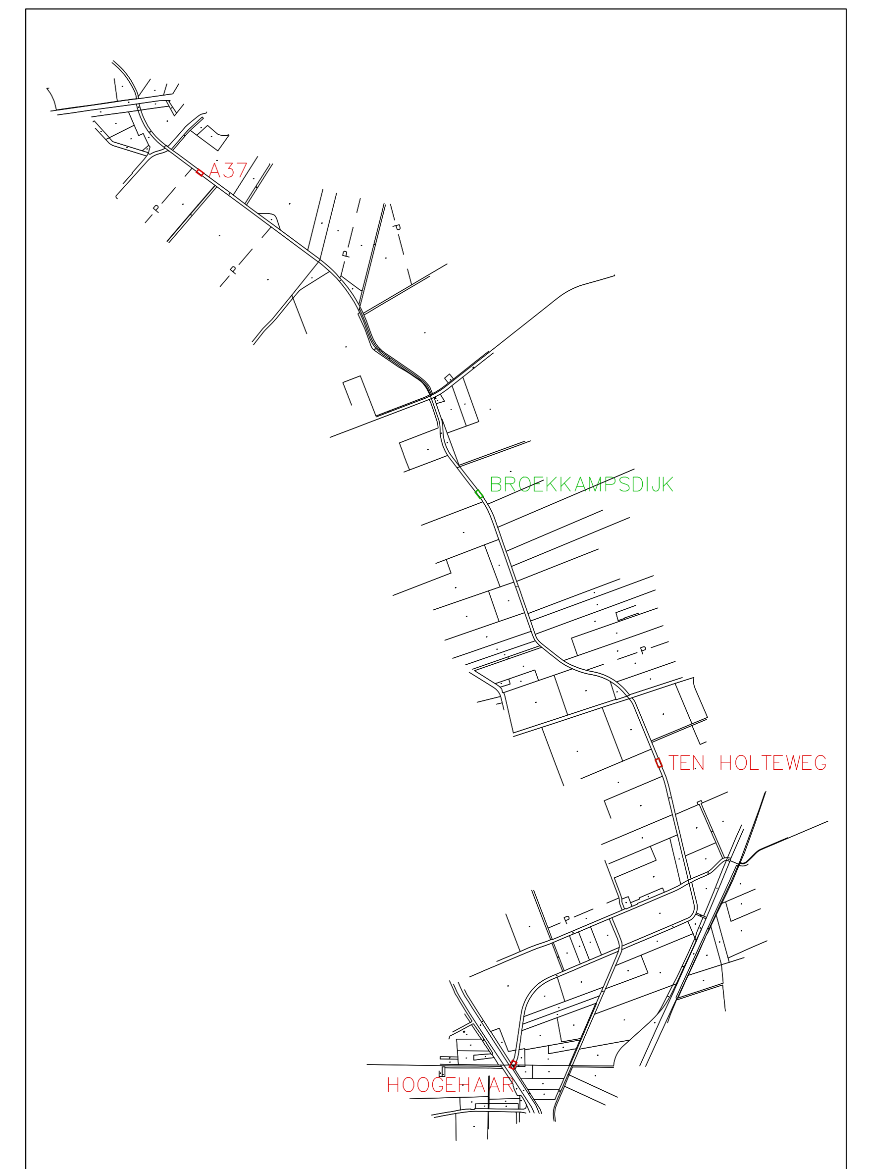
OVERZICHTSKAART LOODIEP SCHAAL 1:20000