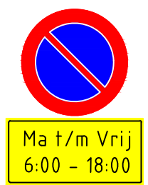
Bord E01 + OB 'Ma t/m Vrij 6:00-18:00'