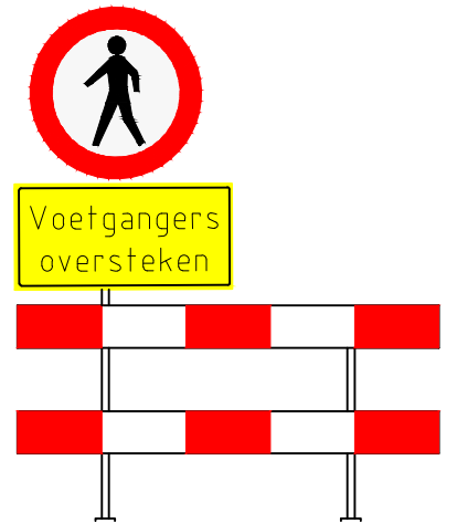
Afzethek + bord C16 + OB 'Voetgangers oversteken'