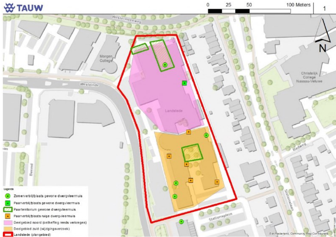
Figuur 1: Het projectgebied (rood omkaderd) met de twee deelgebieden: noord (roze) en zuid (oranje).