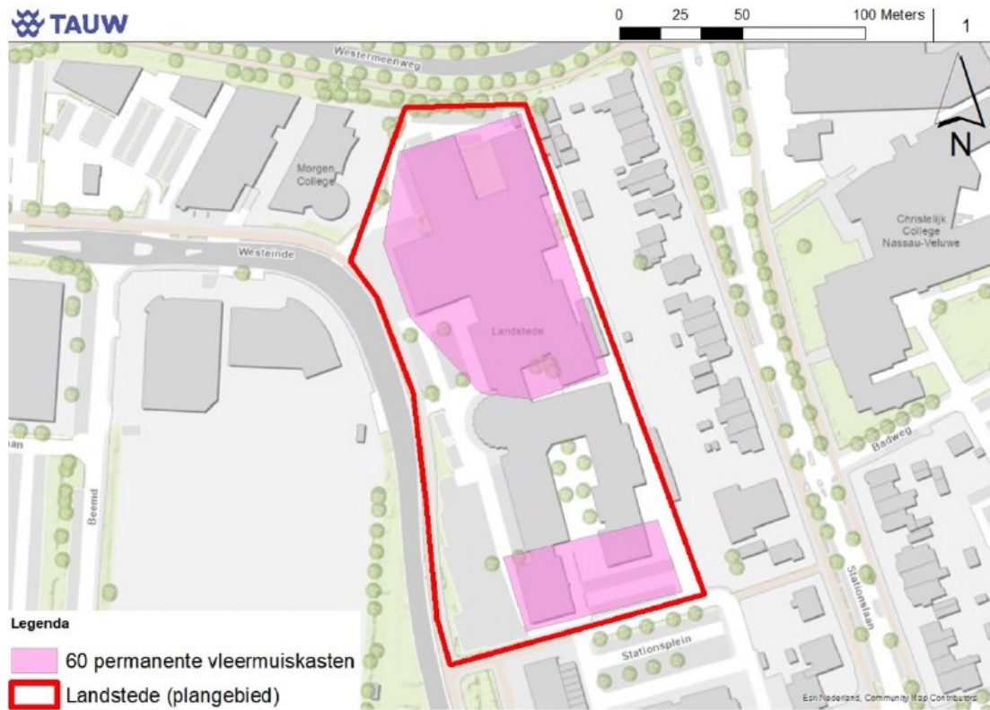
Figuur 3: De globale locatie van de nieuwbouw, waarin 60 permanente inbouwkasten type Kleine Tichelaar of vergelijkbaar worden geplaatst (roze).