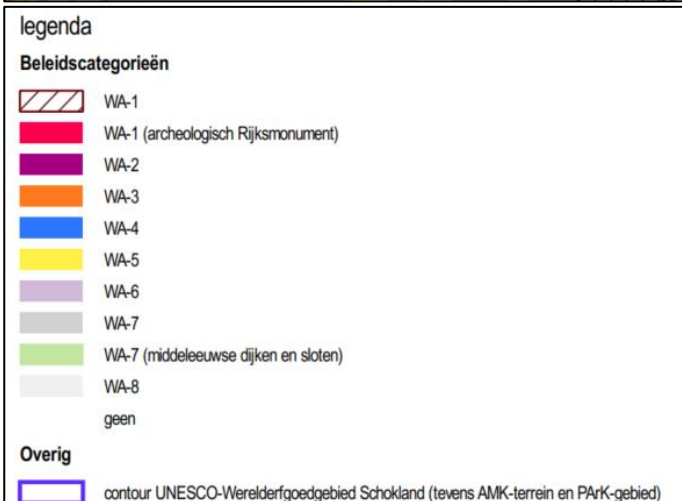
Afbeelding 2: Uitsnede archeologische beleidskaart van de gemeente Noordoostpolder. De blauwe cirkels geven de nieuwe graven locaties aan (bron: RAAP 2018, via gemeente Noordoostpolder).

De te graven locaties liggen niet binnen een dubbelbestemming archeologie, conform het vigerende bestemmingsplan Landelijk Gebied 2004 (vastgesteld 21-03-2016). In het kader daarvan is er dus geen verplichting tot archeologisch onderzoek. De gemeente Noordoostpolder beschikt echter ook over een eigen beleidskaart, opgesteld in 2018. Deze beleidsregels zijn echter nog niet in een bestemmingsplan vastgelegd.