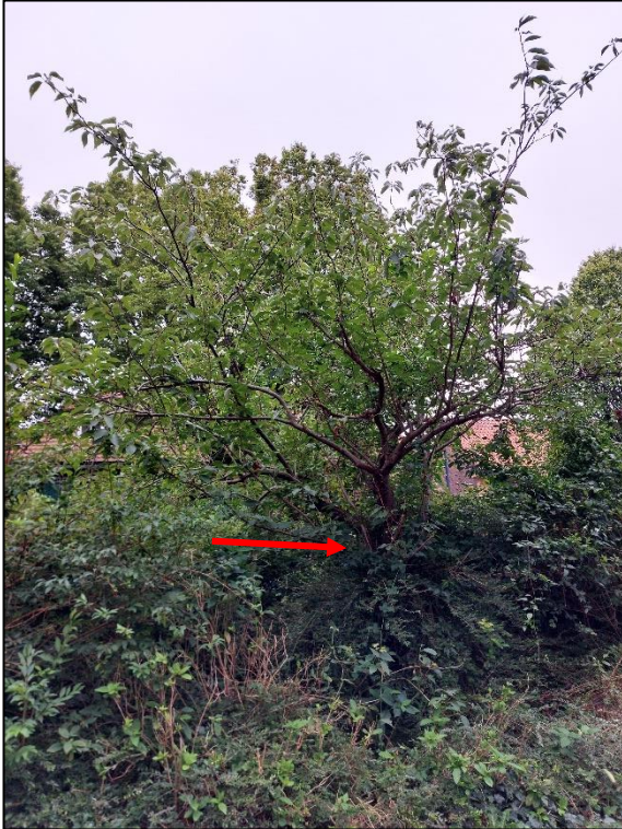
De boom is middels rode pijl gemarkeerd