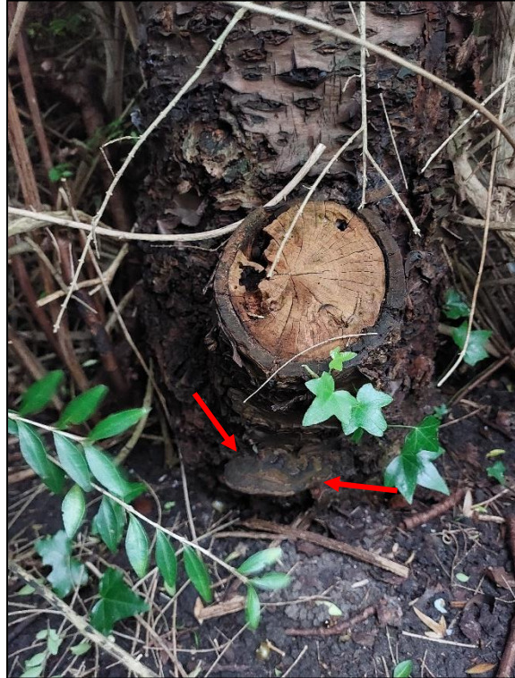
De stamvoet is aangetast door de dikrandtonderzwam